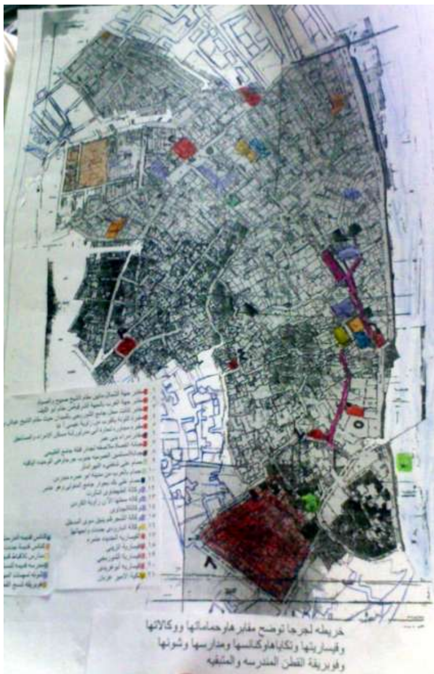
خريطة (٥) لجرجا توضح مقابرها وحماماتها ووكالاتها ونكايها وكنائسها ومدارسها وشونها وفوبريقة القطن المندرسة والمتبقية