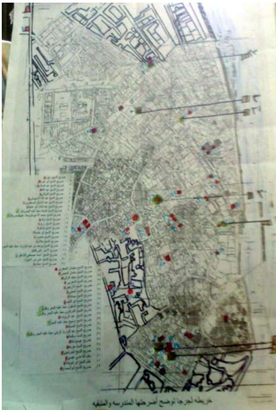
خريطة (٤) لجرجا توضح أضرحتها المندرسة والمتبقية