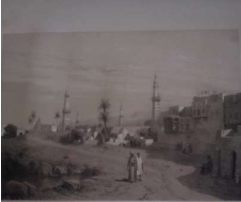
لوحة (١) تمثل جرجا وماكان بهامن منازل ومساجد وأضرحة عن Atex Rida, Ete Barbot, Souvenirs D'Egypte