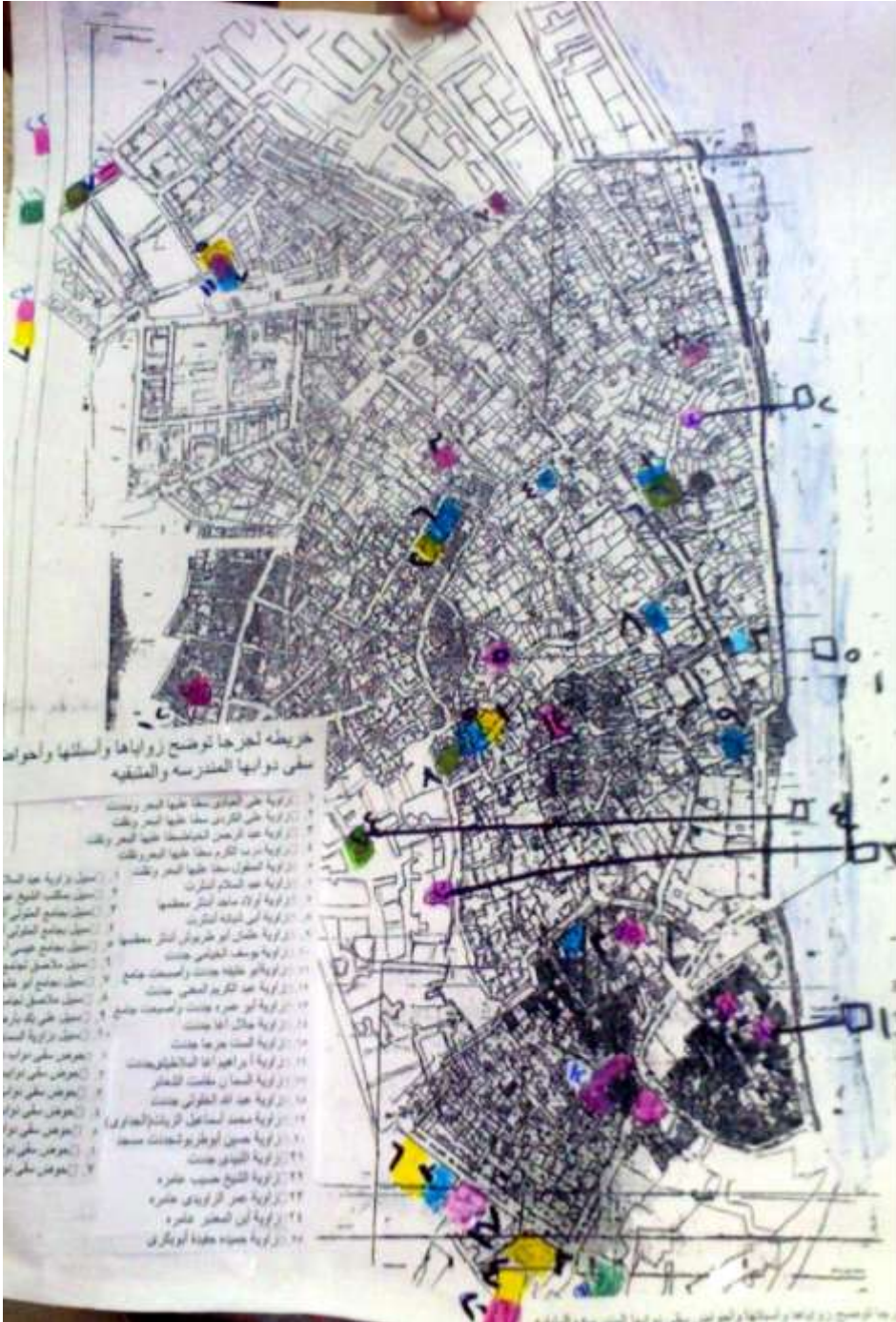
خريطة (٣) لجرجا توضح زواياها وأسبلتها وأحواض سقى دوابها المدرسة والمتبقية