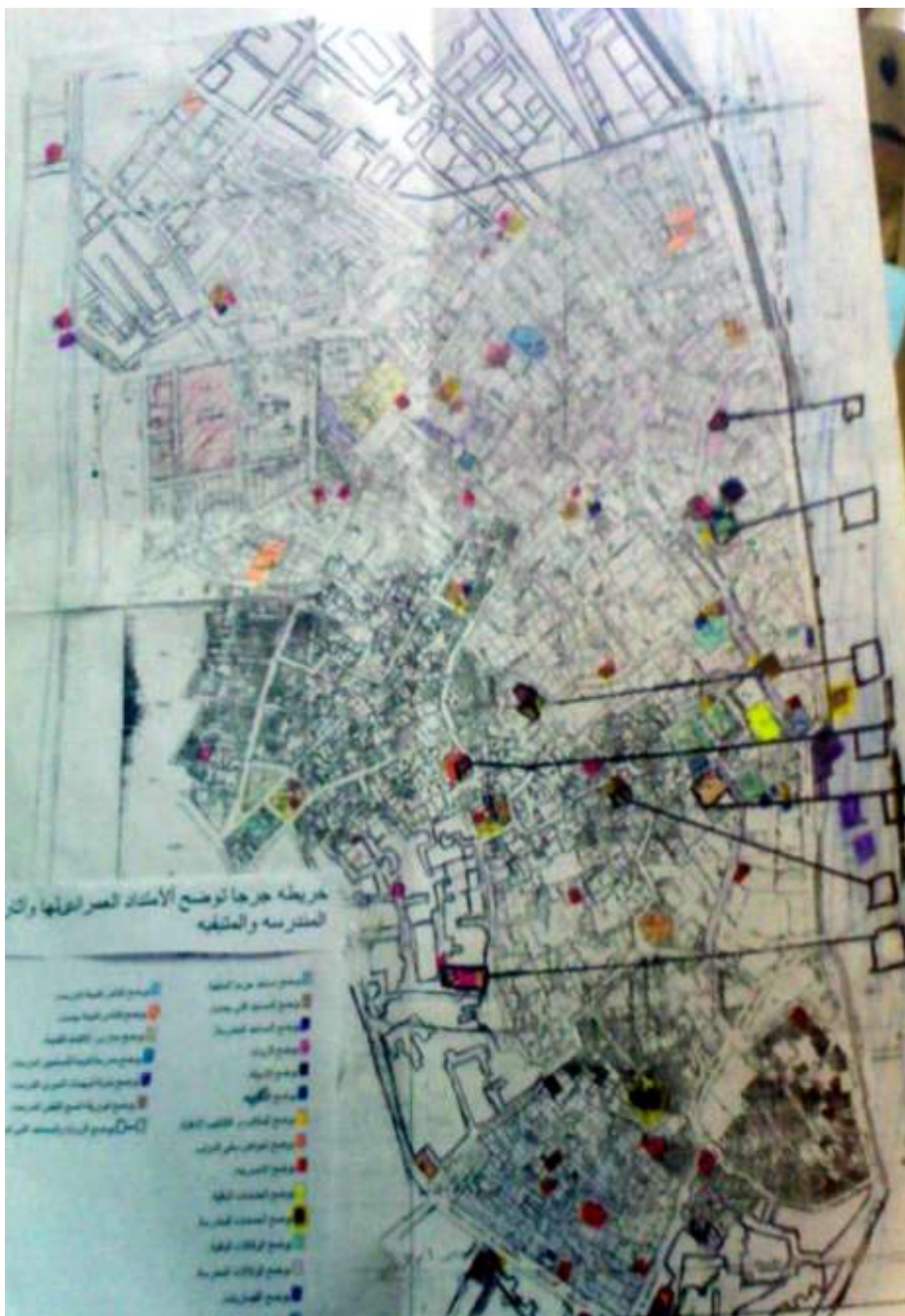
خريطة (١) توضح الإمتداد العمراني لمدينة جرجا وأثارها المدرسية والمتبقية