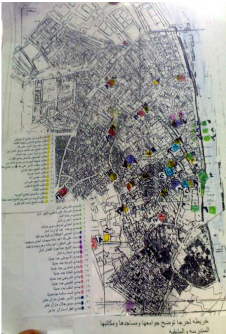
خريطة (٢) لجرجا توضح مساجدها الجامعة ومكاتبها المدرسية والمتبقية