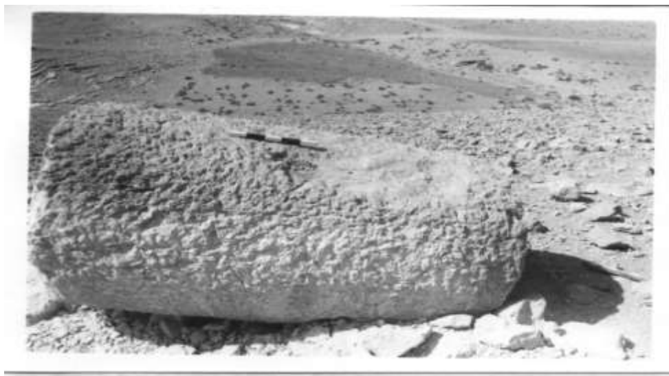
لوحة رقم ٨: أ) منظر يوضح نوع الصخر الذي استخدم كمصدر لصناعة الأعمدة.