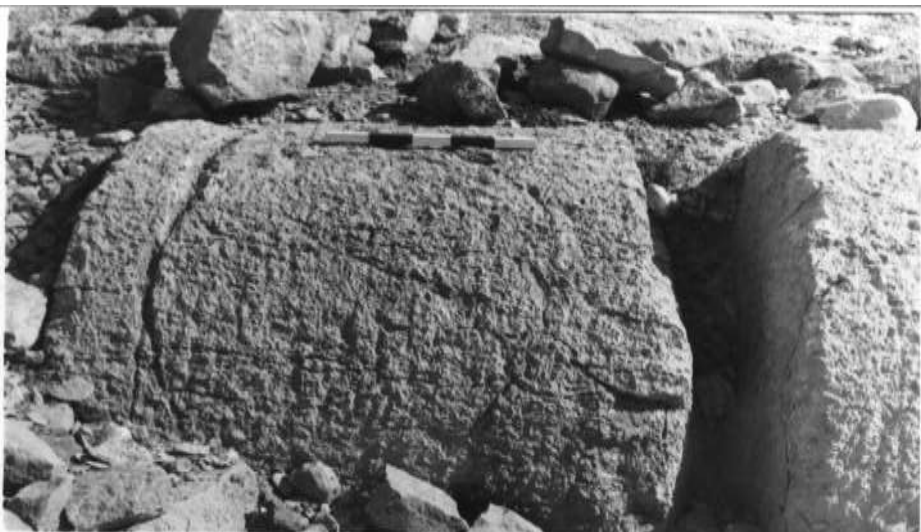
لوحة رقم ٧: