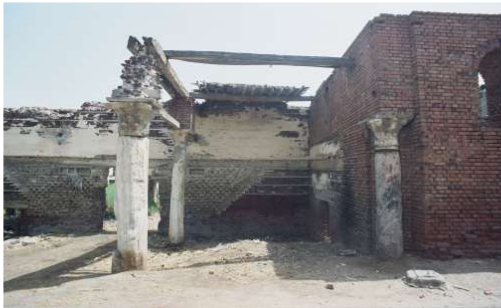
لوحة رقم (٦) المدخل الغربي للمسجد