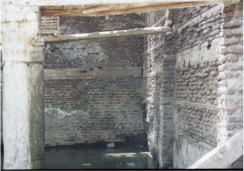
لوحة رقم (٤) الكتابات الكوفية بالرواق الجنوبي