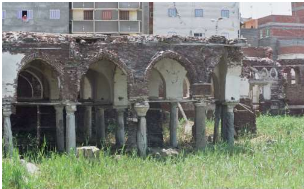
لوحة رقم (٢) الرواق الجنوبي لمسجد عمرو