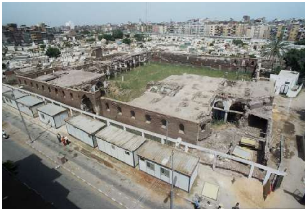
لوحة رقم (١) منظر عام لمسجد عمرو بن العاص بدمياط