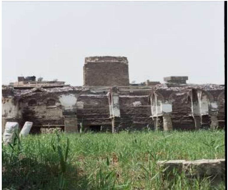
لوحة رقم (٥) الرواق الغربي وبقايا المئذنة