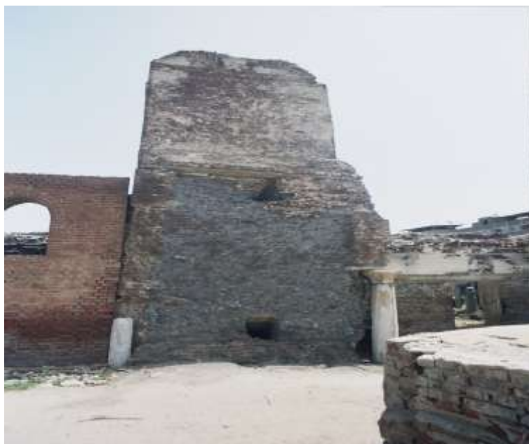
لوحة لرقم (٧) قاعده الؤذنة