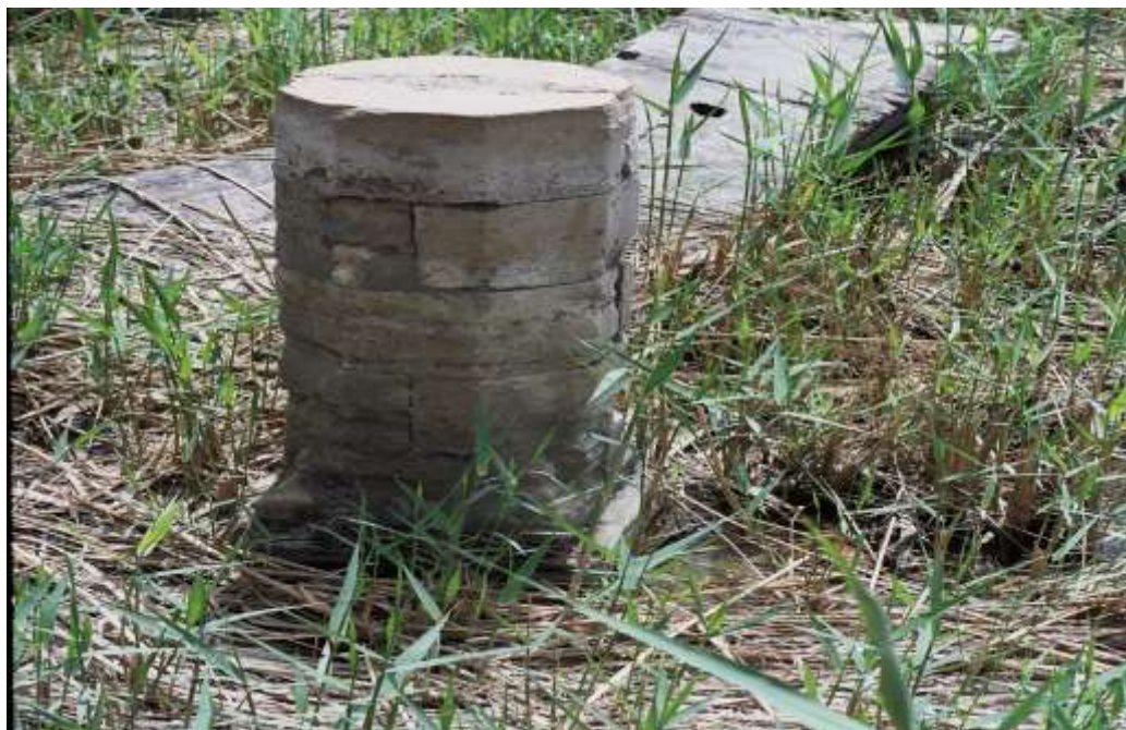
لوحة رقم (٣) عمود من الحجر بالرواق الشمالي