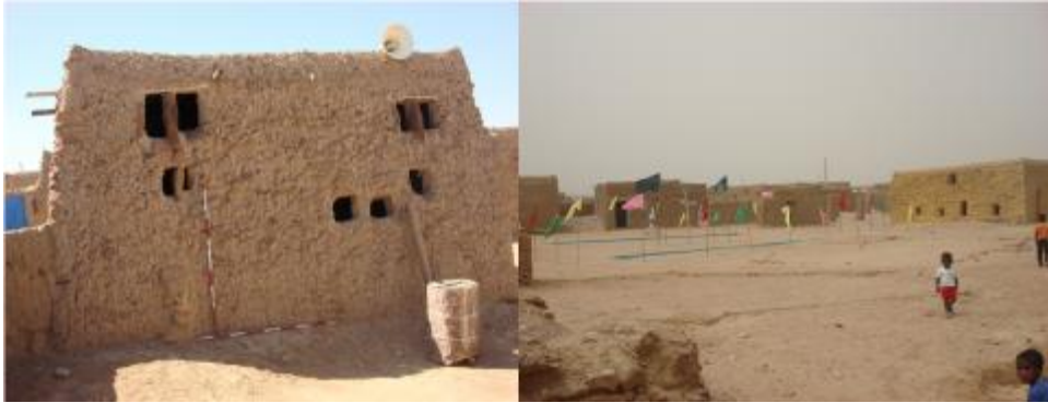
الصورة رقم (٧) نماذج من مواقع العبادة

أما مواقع العبادة فهي أيضاً موجودة داخل الأحياء السكنية الحديثة ويتم استخدام جلها حتى اليوم. وهي عادة ما تكون غرف صغيرة شكلها مربع بنيت من الطين (الصورة رقم ٧). وقد كان وما زالت تؤدي وظيفة المدارس القرآنية ومواضع للصلاة الجماعية، والاحتفالات الدينية المختلفة.