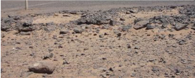
الصورة رقم (٤) مباني فترة ما بعد مروى بمنطقة الدراسة

أما مساكن فترة ما بعد مروى فلم يتم العثور الا على مبان حجرية متراصة، وغير منتظمة في شكلها وطريقة بنائها، تناثرت بداخلها بعض قطع الفخار التي تدل عليها (الصورة رقم ٤).