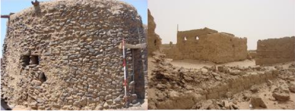
الصورة رقم (٦) نماذج من المساكن الاسلامية