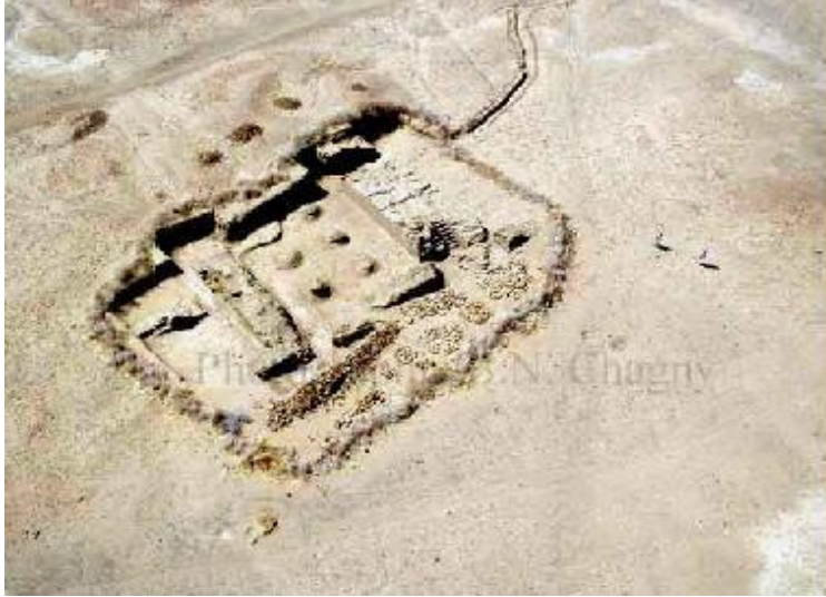
الصورة رقم (٢) صورة جوية لموقع الضانقيل أثناء التنقيب

شمال مدينة عطبرة بحوالي ٦٥ كلم. وذلك وقد كان الموقع عبارة عن أكوام كبيرة لحطام مدينة مروية. وقد كشفت عمليات التنقيب التي تجريها الهيئة السودانية للآثار والمتاحف عن وجود معبد بداخلها به نقوش للإله حابي اله النيل في الديانة المصرية القديمة، ونقوش أخرى تحمل اسم الملكة «اماني تيرى» وزوجها «نتكماني» المدفونين في مروى، ويعود تاريخيا للفترة من القرن الأول ق.م إلى القرن الأول الميلادي. (الصورة رقم ٢).