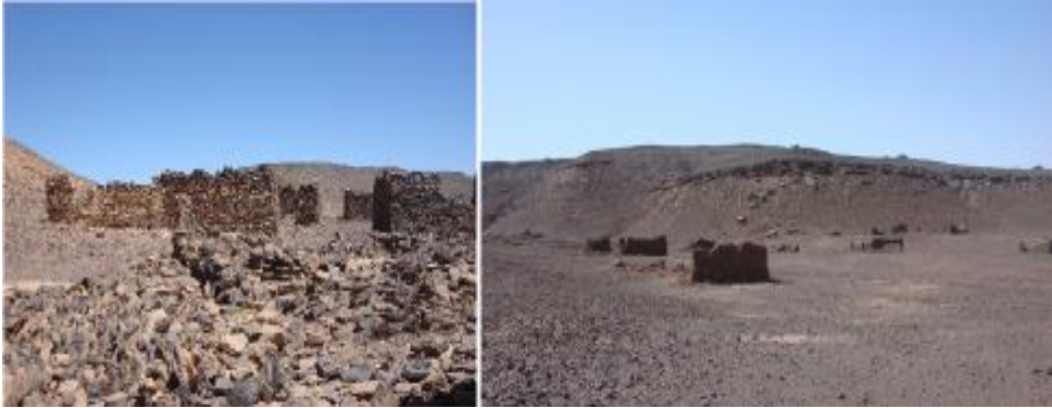
الصورة رقم (٥) مباني يعتقد بانها اسلامية بمنطقة الدراسة

المساكن التي تم كشفها نوعين: الأول عبارة عن غرف مبنية من الحجر في شكل دائري أو مربع أسفل السلاسل الجبلية التي تحيط بالجزء الجنوبي من منطقة الدراسة (الصورة رقم ٥). ولم يتم العثور على أي مواد أثرية متناثرة في أو بالقرب منها تدل على تاريخها، غير أن الروايات الشفاهية تؤكد أن أسلاف سكان هذه المنطقة وهم من العرب المسلمين كانوا يقطنون بها. وهذا يشير الى أنها ربما بنيت في بواكير انتشار الإسلام في السودان، وربما قبل ذلك. وحتما ستكشف عمليات التنقيب عن مدى صحة هذه الروايات.