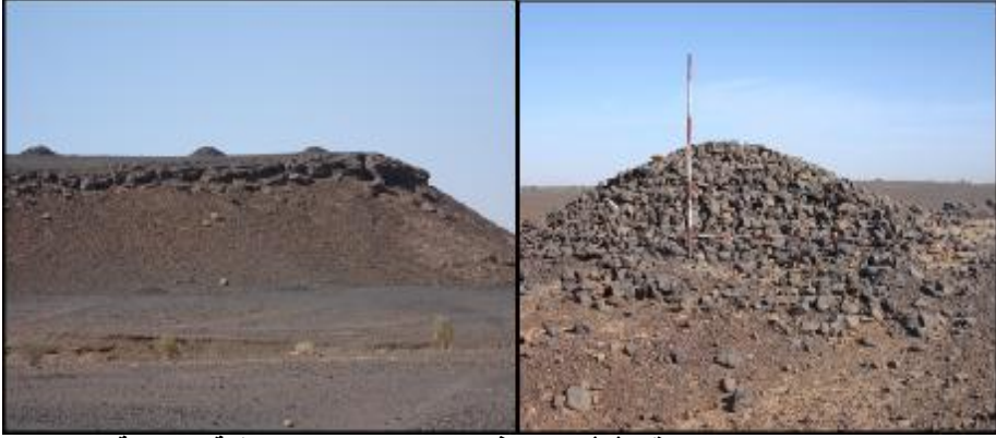
الصورة رقم (٣) مقابر فترة ما بعد مروى بمنطقة الدراسة

ويظهر هذا الانتشار الكثيف لمقابر فترة ما بعد مروى جلياً في المنطقة التي تمسحها في الموسم الأول. وقد وضح ان كل المرتفعات والجبال التي تحيط بهذه المنطقة لا تخلوا من مقابر تعود لهذه الفترة. وهي عبارة عن تلال ضخمة مغطاة بالحجر (الصورة رقم ٣).