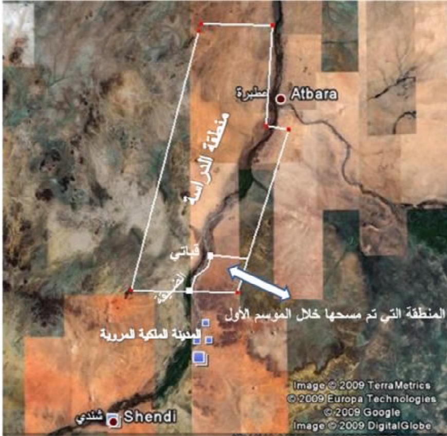
الصورة رقم (١) صورة جوية لمنطقة الدراسة والمنطقة التي تم مسحها في الموسم الأول مواقع الآثار المروية:

على حافة المنطقة الزراعية المتاخمة للنيل بالقرب من قمة جبالية معزولة بقريّة المطمر (١٧,٠٥,٣٨٧ ش / ٣٣,٤٢,٠٤٨ ق) تم العثور على بقايا موقع مروى مسور بجدران سميكة من الحجر، يضم حطام الطوب الأحمر والفخار وحطام اعمدة من الحجر تشبه الى حد كبير المعابد التي انتشرت في الحضارة الكوشية (نبتة ومروى). وقد زار الموقع الألماني Hintze في العام ١٩٥٨م ووجد العديد من المواد الاثرية المتناثرة في الموقع منها بعض الحجارة التي نقشت عليها كتابات باللغة المروية. وقد أكد وجود بقايا معبد داخل الموقع المسور ١ .