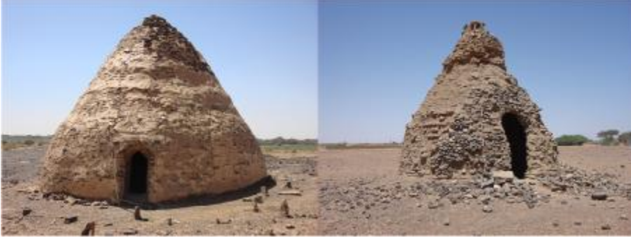
الصورة رقم (٨) نماذج من من الأضرحة

دائرية الا أن الاختلاف يأتي في طول وتر الدائرة وارتفاع القبة هذا بوثر في شكل الأضرحة حتى تبدو للناظر اليها من الوهلة الأولى مختلفة تماما. الصورة رقم (٨)