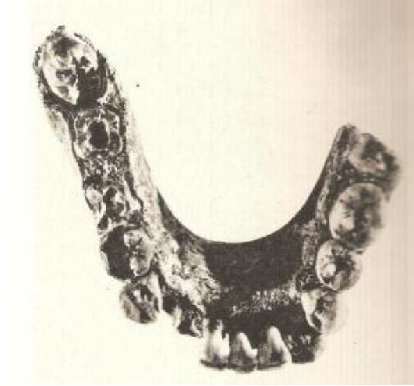
صورة رقم ١ فك لبشر الرباط المكتشف سنة ١٩٣٣