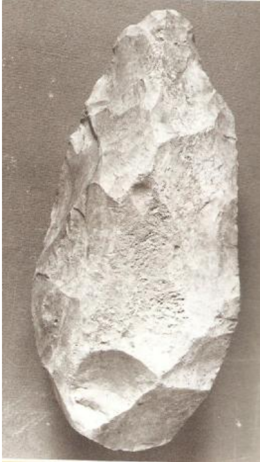
صورة رقم ٣ أ أداة أشولية أخرى