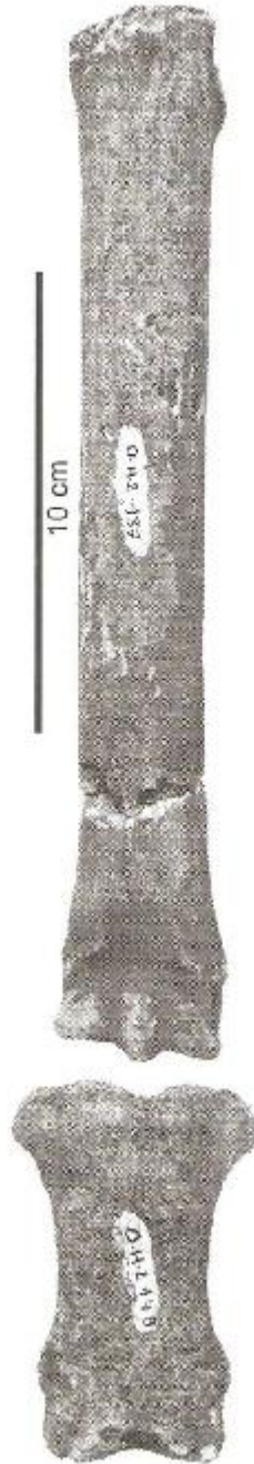
صورة رقم ٥ بقايا عظمية لفرس عن Raynal, 2008, p193