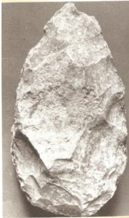
صورة رقم ٣ نموذج لأداة أشولية