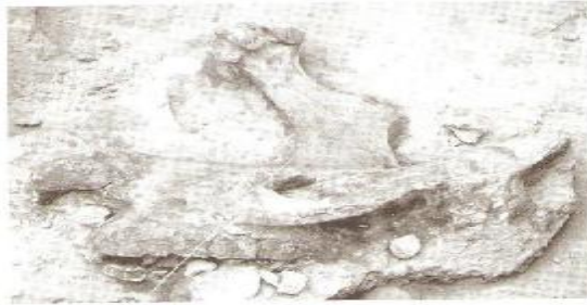
Photo 9 Casablanca, carrière Oulad Hamida 1, fouilles 1991, vue rapprochée d'ossements de rhinocéros et d'outils en quartzite.

صورة رقم ٤ صورة مقربة لعظام الكركدن، وحيد القرن، مع أدوات من الكوارتزيت من محجر أولاد حميدة بالدار البيضاء، عن Sbihi-Alaoui fz.& Raynal jp., Casablanca : un patrimoine préhistorique exceptionnel, Casablanca :an exceptionnal Prehistoric Heritage,Bulletin d'Archéologie marocaine,XX,p.17-« ,p.40