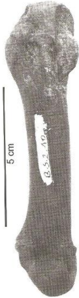
صورة رقم ٦ بقايا عظمية لأسد عن Raynal, 2008 , p190.