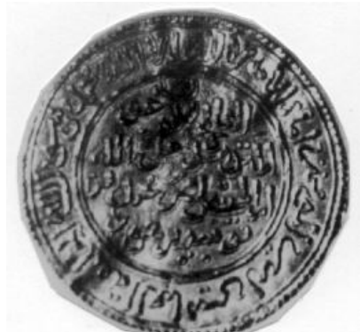
لوحة (٨) دينار مضاعف ضرب مرسية سنة ٦٢٦ هـ باسم المتوكل على الله محمد بن يوسف بن هود. (GomezNo. 216)