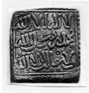
لوحة (14) درهم ضرب أشبيلية غرناطة باسم محمد بن الأحمر الغالب بالله الأخضر درياس : جامع المسكوكات لوحة رقم XVI