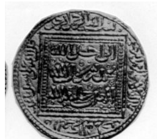
لوحة (١٥) دينار مضاعف باسم بنى حاكم حفص أبي زكريا يحي الأول ضرب غرناطة لا يحمل تاريخ السك. (GomezNo. 238).