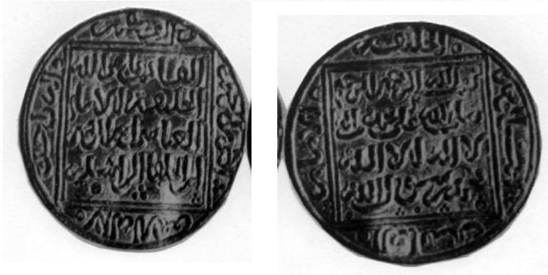
لوحة (٢) دينار ينسب لبني هود في الأندلس لا يحمل مكان أو تاريخ السك (Lorente: Ceuta, No. 173)