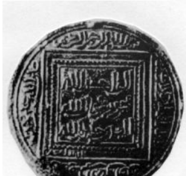
لوحة (١٨) دينار مضاعف ضرب اشبيلية باسم الحاكم الحفصي الأمير أبي زكريا يحي الأول. (GomezNo. 210)