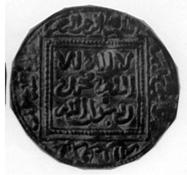
لوحة (١١) ٤/١ دينار ضرب مرسية سنة ٦٥٠هـ من فترة بهاء الدولة ابن هود (lorente,p.38).