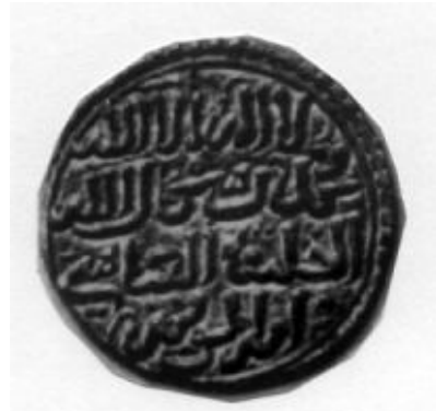
لوحة (٩) درهم من فترة المتوكل على الله محمد بن يوسف بن هود يحمل اسم ولي عهده الواثق بالله. (GomezNo. 235)