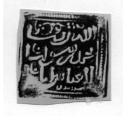
لوحة (١٢) ١ درهم ضرب بلنسية لأبي جميل زيان. (GomezNo. 207).