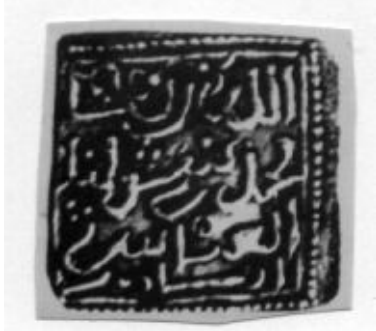
لوحة (١٧) درهم باسم أمير المغرب المستعين بالله بن موسى بن محمد بن نصير بن محفوظ الأخضر درياس :جامع المسكوكات لوحة رقم XVI