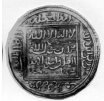
لوحة (١٦) دينار مضاعف باسم باسم محمد بن الأحمر الغالب بالله لا يحمل مكان أو تاريخ ضرب. (GomezNo. 238)