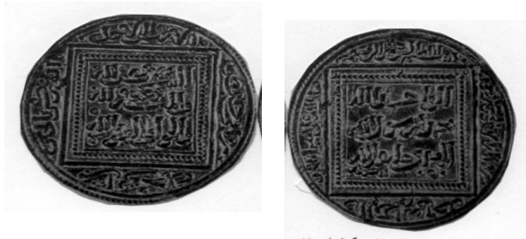
لوحة (٦) دينار مضاعف باسم الخليفة العباسي ينسب إلى يوسف بن محمد المعروف بابن الأمير والي طنجة . (GomezNo. 215)