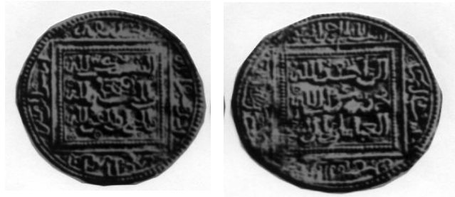
لوحة (٥) دينار مضاعف ضرب سبتة باسم الحاكم الحفصي أبي زكريا يحيى الأول. (Lorent: Ceuta No.