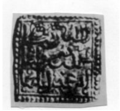
لوحة (١٣) درهم ضرب أشبيلية للقاضي أحمد بن محمد الباجي (GomezNo. 209).