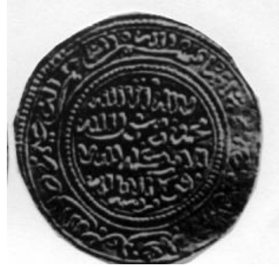
لوحة (١٠) ٢/١ دينار ضرب مرسية باسم الواثق بالله محمد بن محمد بن يوسف بن هود. (GomezNo. 218).