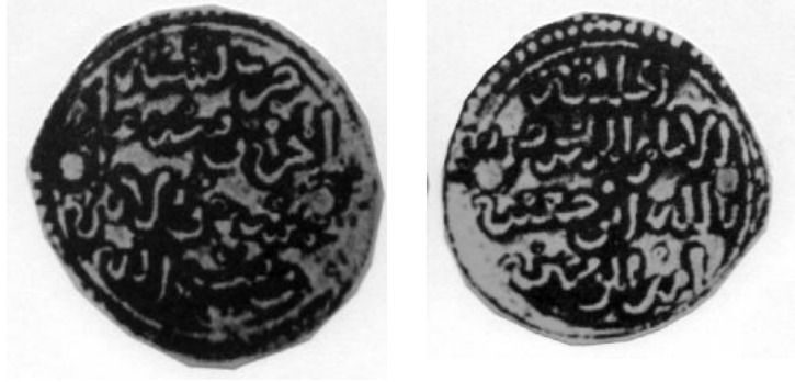
لوحة (٤) درهم ضرب سبتة المحروسة سنة ٦٣٥هـ، ينسب للحاج أبو العباس بن أحمد اليانشتي. (GomezNo. 212)