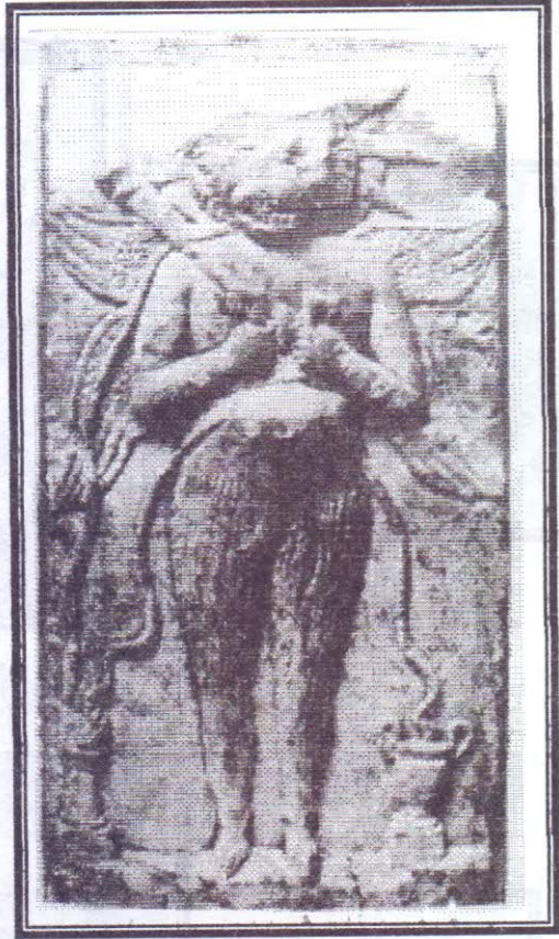
صورة رقم (٧)