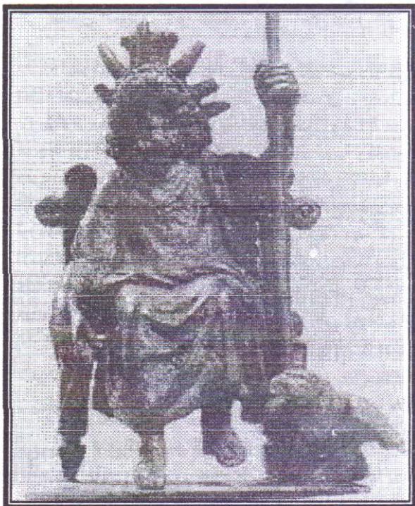
صورة رقم (٢)