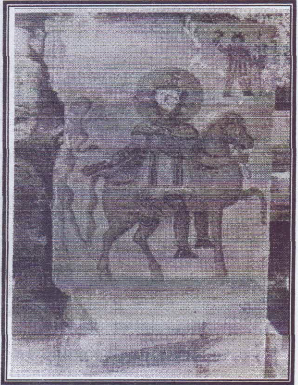
صورة رقم (٦)