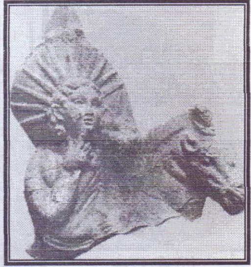
صورة رقم (٤)