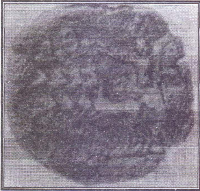
صورة رقم (١٣)