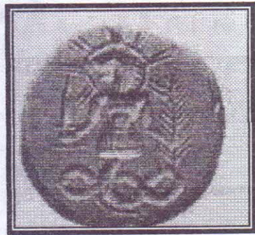
صورة رقم (٩)