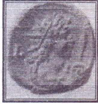
صورة رقم (١١)