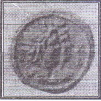
صورة رقم (١٢)