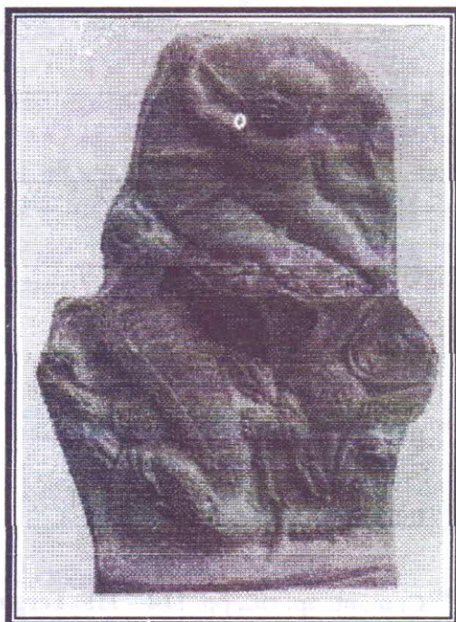
صورة رقم (٣)