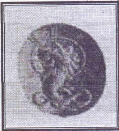
صورة رقم (١٠)