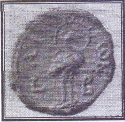
صورة رقم (٨)