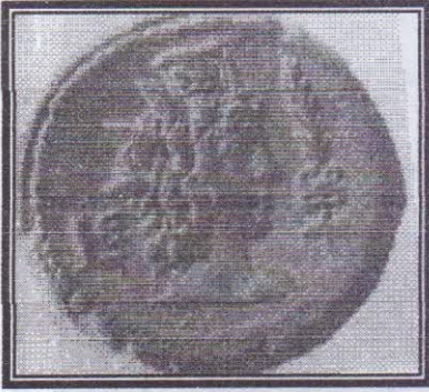
صورة رقم (٥)