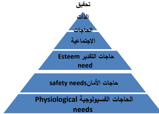
شكل (٢) التقسيم الهرمي للحاجات عند ماسلو

٢- نظرية إريكسون Erickson في (النمو النفسي والاجتماعي): حيث يشير إريكسون (Erickson) إلى أن الأمن والحب والثقة في الآخرين يقابلها حاجات أساسية يؤدي إشباعها خاصة في السنوات المبكرة من الطفولة إلى سيادة الإحساس بالطمأنينة النفسية في المراحل العمرية اللاحقة. إن المرحلة الأولى (الثقة مقابل عدم الثقة) والمرحلة السادسة (الود مقابل الانعزال) في تصنيف إريكسون للمراحل الثمان في النمو النفسي الاجتماعي تعكس هذه الرؤية فالطفل في السنتين الأوليين إن لم يتحقق له الحب ويشعر بالأمن فقد ثقته في العالم من حوله وطور مشاعراً من عدم الثقة في الآخرين بالانعزال والابتعاد عنهم وكذلك الحال في بداية سن العشرينات، ففشل المراهق في تطوير علاقات حميمة مع الآخرين يجعله يميل إلى العزلة نتيجة فقدانه للإحساس بالأمن. (عسيري، ٢٠٠٤)