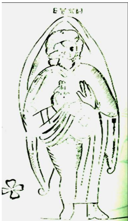
شكل رقم (٧)

الموضوع: تشخيص الصلاة. طريقة التنفيذ: الفريسكو. مكان الاكتشاف: مزار السلام بالبحوات. التاريخ: القرن الخامس الميلادي. المرجع: أحمد فخري، جبانة البحوات، شكل رقم ٦٧.