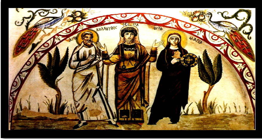
شكل رقم (٨)

الموضوع: تصور المتوفاة ثيودوسيا تقف في المنتصف بين العذراء والقديس كولوئوس