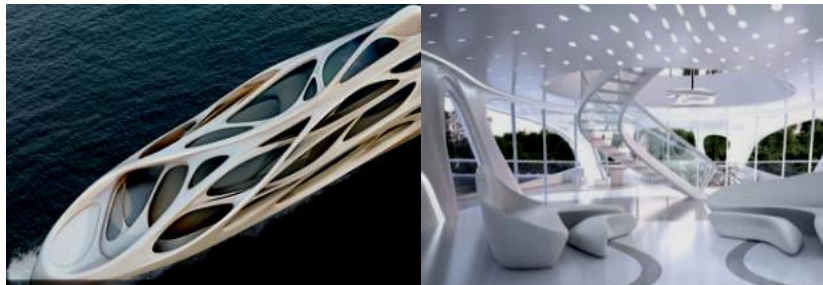
صورة (4) صور ليخت تصميم زاها حديد توضح التصميم الداخلي الانسيابي مستلهم من حركة الماء

وأيضاً علي نطاق التصميمات المتحركة كالبيخوت نجد صورة (4) صور ليخت تصميم زاها حديد توضح التصميم الداخلي الانسيابي مستلهم من حركة الماء ومتوافق معها ليوحي بالديناميكية والحركة كما يظهر بالتصميم الداخلي توافق وانسجام التصميم الداخلي مع التصميم الخارجي وتصميم الأثاث ليكمل التصميم بشكل انسيابي. (5- ص 13).