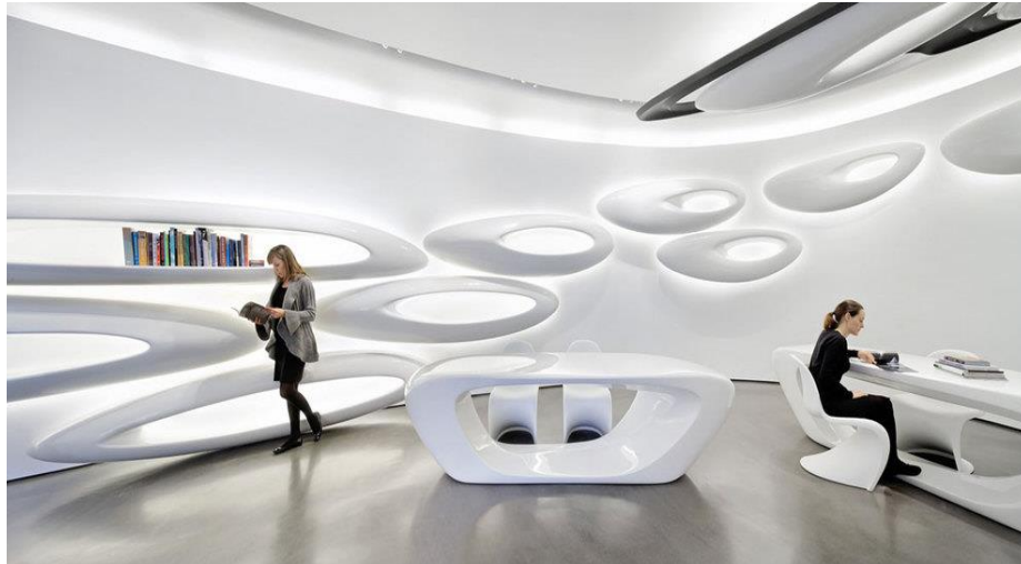
صورة رقم " 6 " التصميم الداخلي لمعرض روكا، ليبدو التصميم وكأنه مكون من خط واحد منحنى مستمر لا يتوقف، ولا تجد له بداية ولا تستطيع أن تحدد له نهاية،