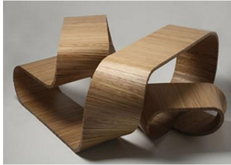
صورة " 10 " تصميم يوضح مفهوم طاولة وكرسي في قطعة واحدة من الأثاث " قطعة اللانهاية " توضح ما بها من الديناميكية - تصميم كريم رشيد.

ويتضح من تصميم الأثاث الديناميكي للبنية الفراغية، حيث عمارة المستقبل، انه البنية ذات الأبعاد المتعددة، حيث يختفي مفهوم الأثاث التقليدي، ليصبح ذاتا في كيانا عضويا واحدا، انه الفضاء الافتراضي في كتلة او مسطح تجريبي، والواقع داخل فكرتها ومضمونها انه الأشكال المجردة التي تطفو وتتماهي في لحن أبدي معبرة عن قوة وحضور الابداع الذاتي. دائما ما تنعكس أفكار الفنان الفلسفية على انتاجه الفني، والفلسفة النظرية، دائما ما تصنع أفكارا واقعية، تترجم الي أشكال عينية محسوسة، من هنا تتجلى أهمية الحوار الإبداعي في تصميم جماليات التصميم الداخلي.