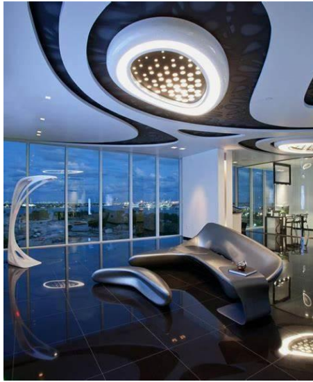
صورة رقم " 5 " توضح خطوطها الانسيابية التي سعت لإذابة الفاصل بين التصميم الداخلي وتصميم الواجهه

ولكل حيز من الحيزات المصممة له مورفولوجيته وطبيعته ومميزاته وامتعته البصرية والعاطفية والفكرية، وأي مبنى يخلق مجموعتين من الحيزات إحداهما داخلية تتكون من عدة أحجام من الحيزات و الأخرى خارجية ، مما يقود إلى ارتباط الحيزات الداخلية بالخارجية في التصميمات العضوية صورة رقم ( 5 ) بصورة واضحة مع توفير الخصوصية و الإنغلاق للحيزات التي تتطلب ذلك ، ويتحقق ذلك بأساليب عديدة منها الحوائط المفتوحة بكاملها كالنوافذ الزجاجية ، ونقل عناصر من البيئة الطبيعية المحيطة إلى الحيز الداخلي للمبنى، وقد جمعت زها حديد بين المستويين الأفقى والرأسى وأعتبرتهم كتلة واحدة نحتية مترابطة تقوم بتشكيلها كما موضح بصورة رقم (6، 7) . ( 15 ) .