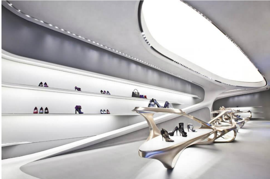
صورة رقم (7) لمحل تجاري من تصميم زها حديد - توضح استخدام الخامات المتطورة ودورها في تطويع تلك الخطوط التصميمية وترك العنان لخيال المصمم في توظيف هذه الخطوط بصورة تعكس إبداعه، مع استخدام التناسق اللوني بين وحدات الأثاث والتصميم الداخلي (14)