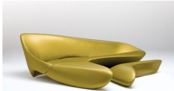
صورة رقم (8) توضح تصميم لبعض قطع الأثاث من تصميم زها حديد

والأختلاف بين النسب المتكررة للأشكال للإيحاء بالاتجاه من ونحو المركز، الإحساس بالهبوط أو الصعود. وقامت زها حديد بزيادة قاعدة الجسم عن الأرتفاع ليوحى بالاستقرار والسكون للأجسام وعلى العكس في بعض الأعمال ليوحى بالحركة كلما مال محوره عن الوضع الطبيعي.