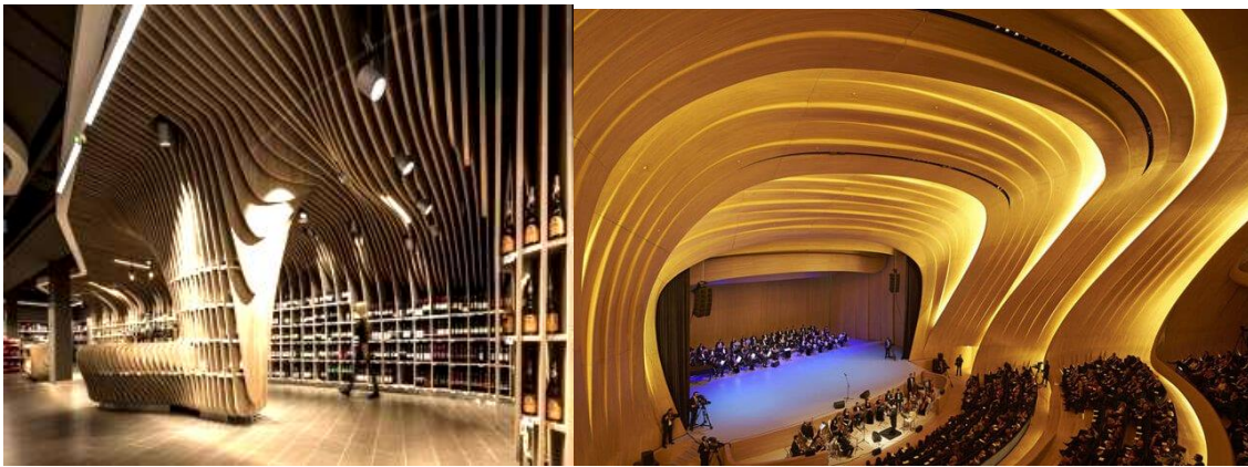
صورة (1) الانسيابية في التصميم الداخلي تميز التصميم بالحيوية والديناميكية و تحقق العمق المكاني والايحاء بالامتداد والحركة

وكان لظهور الحاسب الالى اثر كبير في احداث طفرة ثورية في مجال الفكر التصميمي الابداعي للعملية التصميمية الذي اثر علي فكر واداء المصمم الداخلي والتي مكنته من الخروج عن الاشكال الاقليدسية الي اشكال يطلق عليها الاشكال الطبولوجية من الناحية الرياضية ذو نظام ديناميكي و ذات تحولات غير متوقعة مما اتاح للمصمم الداخلي ابتكار حلول فراغية و فكر مختلف من خلال دمج الفراغ ببعضه، كما استخدام مبدأ السبولة في التصميم الداخلي في بعض الأماكن التي لم يستخدم بها هذا المفهوم في التصميم المعماري الخارجي لخلق بيئة داخلية جديدة أو التغلب على رتابة التصميم أو تحويل المبني الكلاسيكي إلى مبني معاصر وغيرها من الاحتياجات الفكرية والتصميمية مما ساعد على عمل معالجات داخلية للفراغ تتسم بالتفرد والحركة كما يظهر في صورة (1) فجميع المعالجات توحى بالديناميكية والحركة وتعطي بعداً للتمدد والانتساع وهو ما يساعد في حل مشكلات التصميم الداخلي للفراغات وتحقق القيمة الوظيفية، كما أنها غير مرتبطة بانسيابية المبني إلا أنها لا تتعارض معه .