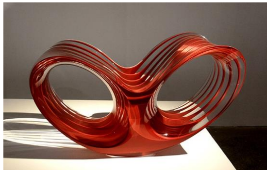
صورة " 9 " المقعد ذو خطوط انسيابية من ناحية الشكل ولكن لو نظرنا إلى دوره الوظيفي نجد أن به عدم اتزان وظيفي.

وتصميم كتل انسيابية وهي كتل يكون مبالغ في تصميمها حيث أنها لا تؤدي الجانب الوظيفي ولا يتحقق بها اي نوع من انواع الاتزان في التصميم، وبهذا يكون بها خلل من ناحية الاستخدام، وفي غالب الأمر تستخدم تلك الكتل لشغل حيز الفراغ أو للتجميل أو لإتزان التصميم كما يظهر بصورة (9، 10) - (1- ص 112).