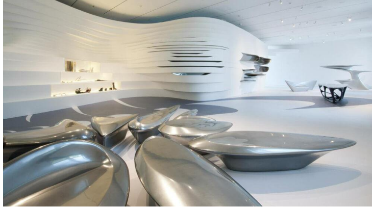
صورة (3) الانسيابية في الفراغ الداخلي عنصر حركة وحيوية

من هنا نجد أن التصميم الداخلي الانسيابي في الفراغ يحقق الوظيفة والحركة معا كما يوحي بالديناميكية وحيوية في تفاعل الفراغ مع الأثاث فيظهر التصميم كوحدة واحدة بايقاع متنوع واحساس بالامتداد وهو ما يفيد في الأماكن الضيقة كما في الصورة الثانية في صورة (3) كما يوحي بالحيوية والحركة في اتجاهات مختلفة وبصورة سلسلة كما في الصورة،