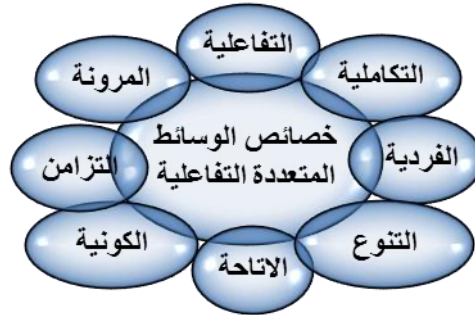
شكل (٢) خصائص الوسائط المتعددة التفاعلية

(أسامة هنداوي وآخرون، ٢٣٢، ٢٠٠٩)، (عبد العزيز طلبة، ١٣٢، ٢٠١٠)