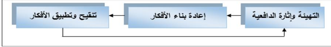
شكل (١) خطوات نموذج التعلم البنائي التكاملي