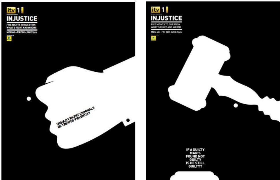
شكل (5) حملة إعلانية مطبوعة لقناة تليفزيونية بريطانية إعتمدت ملصقاتها على توظيف الفراغ الإيجابي، حيث تمثل الصورة الرئيسية الأداة المستخدمة في العنف والفراغ المتولد من الصورة يمثل شكل الشخص الذي يتعرض للعنف - 2011م. [26]