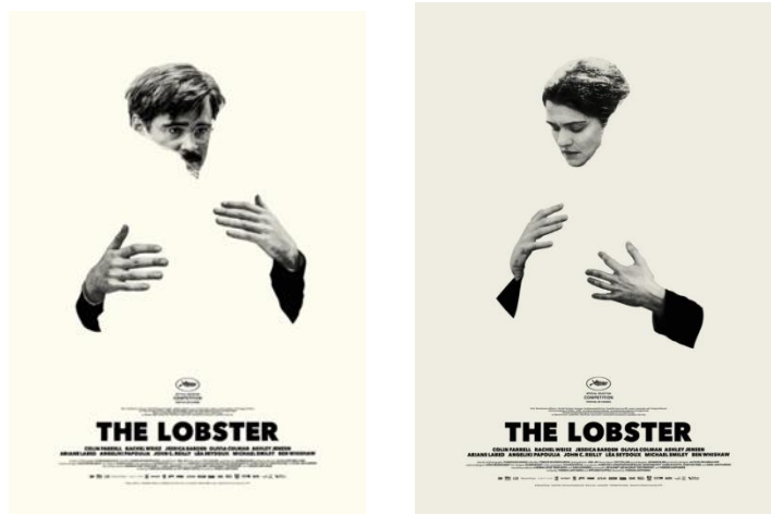
شكل (9) ملصق إعلاني لفيلم The LOBSTER (فيلم خيال علمي) اعتمد على توظيف الخداع البصري حيث تمثل الصورة الرئيسية لكونين فاريل بطل الفيلم وهو يحتضن شخص آخر وهي راشيل وايز والتي تتجسد في الفراغ المتولد من الشكل والعكس في الملصق الثاني، وهو يعكس هدف الفيلم "أن الإنسان دائماً يريد أن يكون في حالة حب مع من حوله" - 2015م. [30]