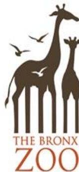
شكل (6) لوجو لحديقة حيوان تم إستغلال الفراغ في أرجل الحيوان لتشبه منظر المدينة للمساعدة في التأكيد على أن هذه الحديقة تقع في حي برونكس، نيويورك. [27]