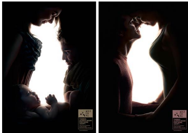
شكل (7) حملة إعلانية مطبوعة اعتمدت ملصقاتها على توظيف الخداع البصري حيث تمثل الصورة الرئيسية عائلة تنظر إلى بعضها البعض ويتم ترتيب الفراغ الإيجابي بينهما بعناية، والفراغ المتولد من الصورة يمثل شكل جسد الحيوان مع إضافة ذكية لشعار الإعلان وهو "هناك دائماً مساحة لشخص آخر" - 2017م. [28]