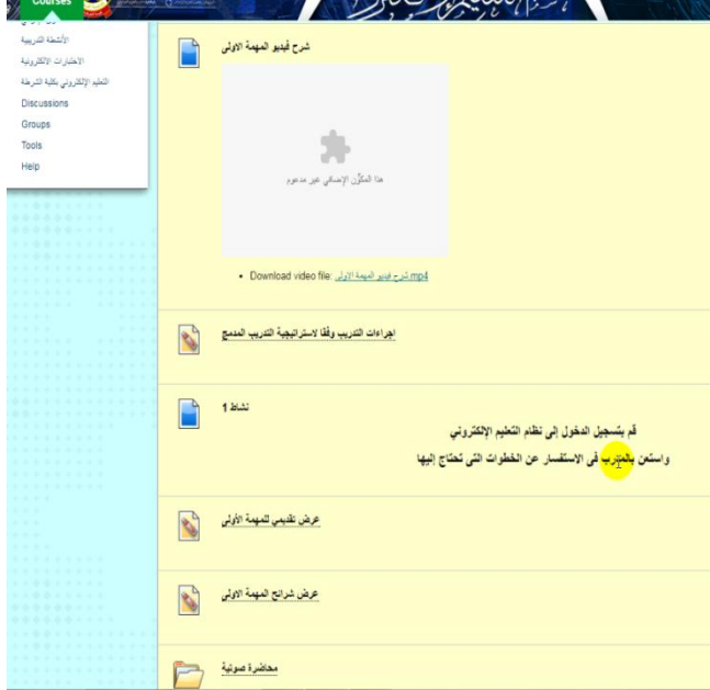
شكل (٢) مكونات المهمة في المقرر الإلكتروني

تم تصميم صفحات المحتوى الداخلي للمقرر الإلكتروني ومرعاة معايير التدريب المدمج.