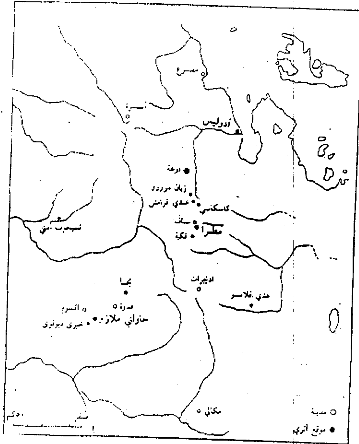
( خريطة رقم ١ )