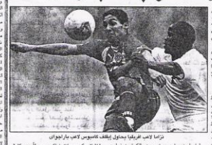
أولاد أفريقيا يعادلون بلاتفيلد كاسين... في مدينة القاهرة... في إطار التعاون...