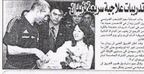
تدريبات علاجية مع فريق الأبحاث... من أساتذة معهد التخصص الفرنسي... في مركز الأبحاث الطبية الحديثة...