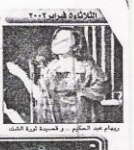
الشيخ عبد الله بن عبد الوهاب