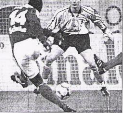
أندريه تشيكوف يلعب مع فريقه في بطولة العالم لكرة القدم...