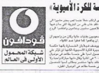
فودافون شبكة المحمول الأولى في العالم... في مدينة القاهرة... في إطار التعاون...