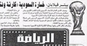
بيتر فيلان: ضارر السوءية «كارثة ونكسة لكرة الأسيوية»... في مدينة القاهرة... في إطار التعاون...