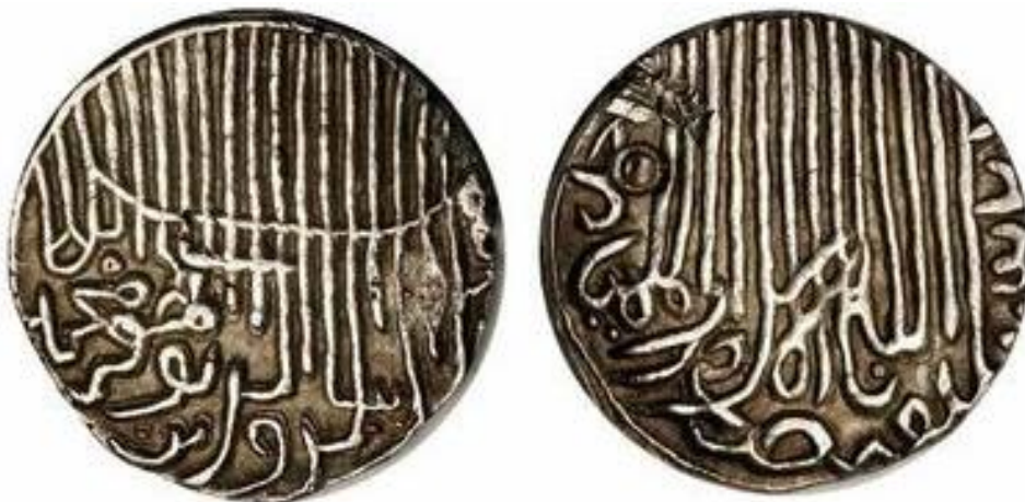
لوحة رقم (٢): تنكة فضية بإسم السلطان جلال الدين محمد شاه، تاريخ الضرب ٨٣٢هـ، دار الضرب أحمد آباد،