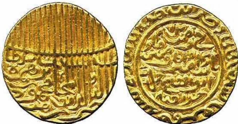
لوحة رقم (٥): دينار ذهبي بإسم السلطان محمود شاه، دون دار ضرب، تاريخ الضرب (٨٤٥هـ)، الوزن (١١،٥١ جرام) منشور علي،

Baldwin's; Auction No. 53, Lot No..1707.