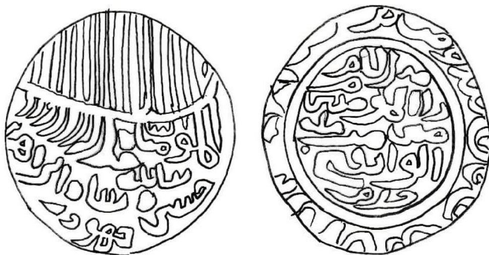
شكل رقم (٦): رسم توضيحي لكتابات وزخارف الدينار العلوي.

Wright ; Catalogue of the Coins of the Indian Museum, Part.2, P.216, No.110.