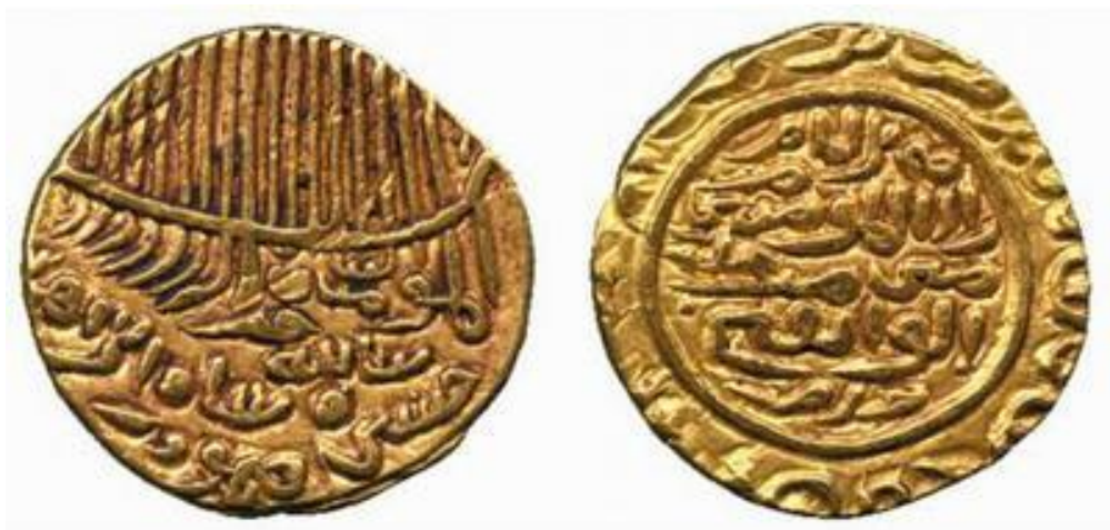
لوحة رقم (٦): دينار ذهبي بإسم السلطان حسين شاه ، دون دار ضرب، جاء تاريخ الضرب مطموساً، غير معلومة الوزن،

Wright ; Catalogue of the Coins of the Indian Museum, Part.2, P.216, No.110.