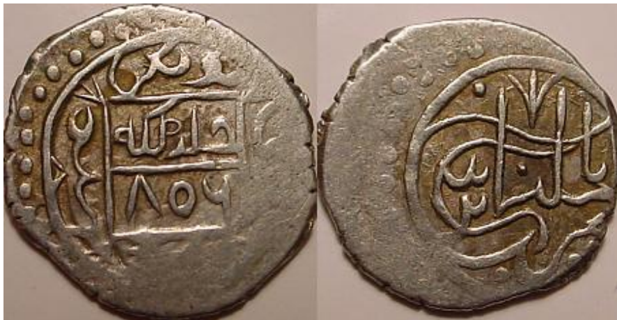
لوحة رقم (١): نقد فضي بإسم الأمير سليمان بن بايزيد، تاريخ الضرب (٨٥٦هـ)، دون دار ضرب، غير معلوم الوزن، منشور علي،

https://www.zeno.ru/showphoto.php?photo=8024