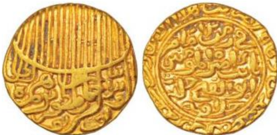
لوحة رقم (٣): دينار ذهبي باسم السلطان إبراهيم شاه شرقي، دون دار ضرب، تاريخ الضرب (٨٢٧هـ)، الوزن (١٠٢٤ جرام) متاحة علي،

Classical Numismatic Gallery (CNG) ; Auction No. 25, 6 Aug 2016, Lot No.1.