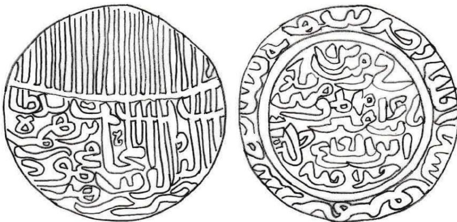
شكل رقم (٥): رسم توضيحي لكتابات وزخارف الدينار العلوي. (من عمل الباحث)

Baldwin's; Auction No. 53, Lot No..1707.