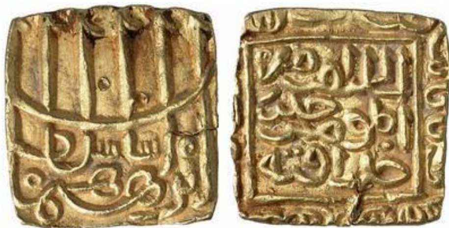
لوحة رقم (٤): دينار ذهبي باسم السلطان إبراهيم شاه شرقي، دون دار ضرب، تاريخ الضرب (٨٤٣هـ)، الوزن (١١،٤ جرام)، منشور علي،

The New York Sale, Auction No. XI, 11 Jan 2006, Lot No. 599.