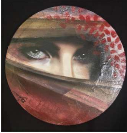
العمل رقم (٢)

تفسير العمل: تعبر اللوحة عن وضع المرأة والرجل والعلاقات الاجتماعية بينهم في ظل التطور السريع الحاصل في المجتمع السعودي في ظل رؤية ٢٠٣٠ وتوجهات المملكة السياسية.