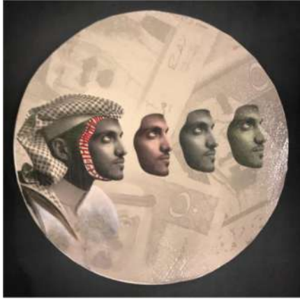
العمل رقم (٤)