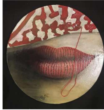
العمل رقم (١)