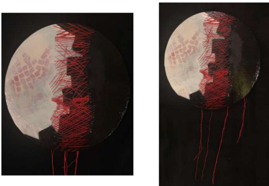
العمل رقم (٧)