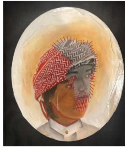
العمل رقم (٥)