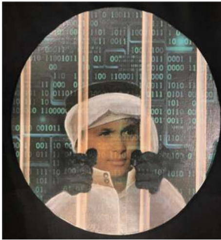
العمل رقم (٦)