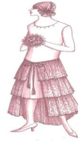
فستان الزفاف ومكملاته عام ١٩٢٨ (John peacock-2005-46) شكل رقم (٩)