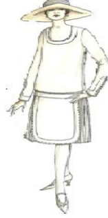
فستان الزفاف ومكملاته عام ١٩٢٩ (John peacock-1993-71) شكل رقم (١٠)