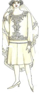
فستان زفاف ومكملاته عام ١٩٢٦ (John peacock-1993-71) شكل رقم (٧)