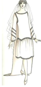
فستان زفاف ومكملاته عام ١٩٢٥ (John peacock-1993-71) شكل رقم (٦)