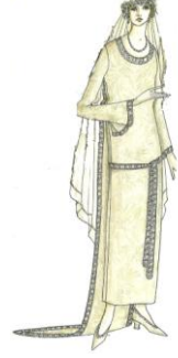
فستان الزفاف ومكملاته عام ١٩٢٤ (John peacock-1993-63) شكل رقم (٥)