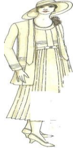
فستان الزفاف ومكملاته عام ١٩٣٠ (John peacock-1993-87) شكل رقم (١١)