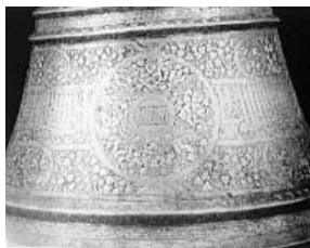
(Fig. 23) Base de chandelier en cuivre incrusté d'or et d'argent au nom du sultan Ahmad fils d'al-Nasir Muhammad ibn Qalawun, vers 743/ 1342, vente aux enchères publiques, London, Christie's, 1995.