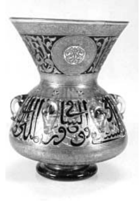
(Fig. 14) Miskah en verre émaillé, au nom de l'émir Qawsun al-Saqi, vers 730/1329, conservée au Musée d'Art Islamique du Caire, n° 334.

disponible sur la lampe. Le texte ne s'arrêterait pas toujours au même endroit 16 : on lit jusqu'à misbah , sur la lampe de Sayhu al-Nasiri (Fig. 3) ; jusqu'à al-misbah , sur les lampes du sultan Hasan (Figs. 12, 13) ; jusqu'à zugaga , sur la lampe de Qawsun (Fig. 14) ; jusqu'à al-zugaga , sur la lampe de l'émir Ulmas al-Hagib, (Fig. 15). et sur celle du sultan Barquq (Fig. 16) ; jusqu'à kawkab , sur la lampe d'Al-Nasir Muhammad ibn Qalawun et sur celle de Qani Bay al-Garkasi inscrit sur le col et sur la panse (Fig. 17).