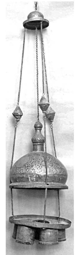
(Fig. 6) Lustre en laiton gravé et ajouré daté de la fin du VII e /XIII e siècle, conservé au Musée d'Art Islamique du Caire, n° 635.