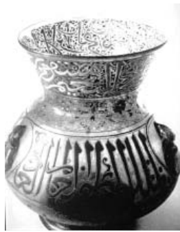
(Fig. 20) Miskah en verre émaillé et doré, au nom du sultan Baybars II, vers 709/1310, conservée au Musée de Victoria et Albert, n° 322-1900.

ina al-abrar lafi na'im, tanzur fi wuguhihim nadrat al-na'im yusqawn min rabiq mahtum , autrement dit : 'Les bons seront dans (un jardin) de délices, tu reconnaîtras sur leurs visages l'éclat de la félicité, on leur sert à boire un nectar pur, cacheté'.