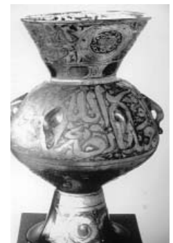
(Fig. 16) Miskah en verre émaillé et doré, au nom du sultan Al-Zahir Barquq, vers 788/1386, conservée au musée de Victoria et Albert, n° 326-1900.