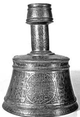
(Fig. 8) Chandelier en cuivre jaune au nom du sultan Qaytbay daté de 887/1482, conservé au Musée d'Art Islamique du Caire, n° 4297.