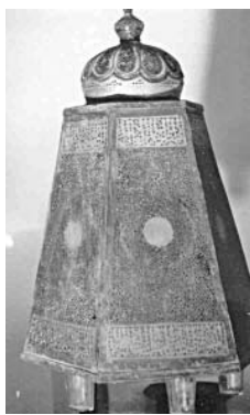
(Fig. 24) Lanterne en cuivre ajouré datant du règne du sultan al-Nasir Muhammad ibn Qalawun entre 693-741/1293-1341, conservé au Musée d'Art Islamique du Caire, n° 638.