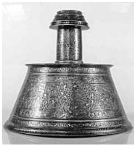
(Fig. 4) Chandelier en cuivre incrusté d'or et d'argent daté de 668/1269, conservé au Musée d'Art Islamique du Caire, n° 1657.

Toutefois, cette prédominance n'était pas absolue, et les deux écritures, nashi et coufique se présentaient souvent réunies sur un même objet. 5