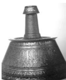
(Fig. 9) Chandelier en bronze coulé incrusté d'argent et de pâte noire, au nom de l'émir Salar, daté de 707/1307, conservé au musée du Louvre, n° AA 101.