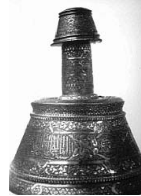
(Fig. 29) Chandelier en alliage de cuivre incrusté d'or et d'argent au nom de Taqay al-Din Abu Bakr daté du milieu du VIIIe/XIIIe siècle, conservé au musée du Louvre, n° 6317.

Nous avons rencontré un autre groupe de vœux, représenté séparément sur quelques moyens d'éclairage mamelouks :