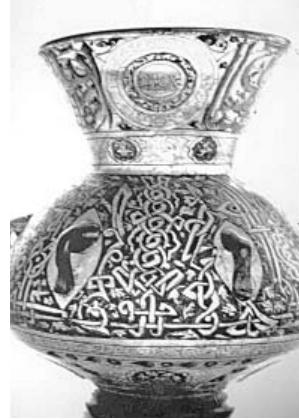
(Fig. 13) Miskah en verre émaillé, au nom du sultan Hasan, entre 756-762/1356-1361, conservée au musée de Victoria et Albert, n° 323-1900.