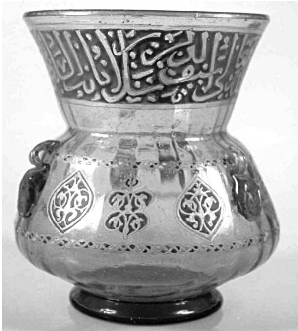
(Fig. 31) Miskah en verre émaillé et doré, au nom de l'émir Salar, vers 703/1303, conservée au Musée d'Art Islamique du Caire, n° 281.

On lit également sur le col d'une miskah au nom de l'émir Salar, datée 703/1303 (Fig. 31), qu'elle a été faite pour le tombeau de l'émir : Mim[a 'u] mi [ la bi ras ] m turbat al-'bd al-faqir ila allahi ta'ala