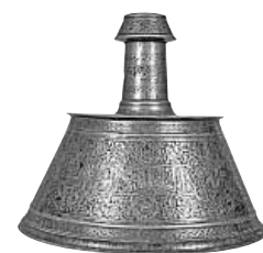
(Fig. 2) Chandelier en cuivre gravé et incrusté d'argent et d'une pâte noire, daté du VIIe/XIIIe siècle, conservé au Musée d'Art Islamique du Caire, n° 4045.