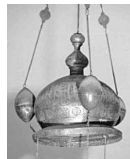
(Fig. 28) Lustre en cuivre ajouré datant probablement de l'époque du sultan Al-Asraf Qaytbay, vers 901/1496, conservée au Musée d'Art Islamique du Caire, n° 637.

Ces titres étaient le plus souvent précédés par l'expression mima 'umila birasm ou 'Voici qui a été fait', qui indique que ces oeuvres font partie des objets commandés au nom d'une certaine personne. Elle était assez fréquente dans les inscriptions mobilières, sur des objets d'art fabriqués à l'usage d'une grande personnalité ou pour un édifice fondé par elle. 98