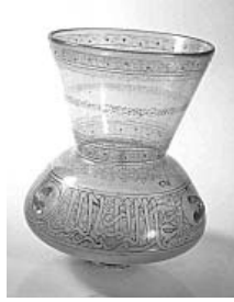
(Fig. 11) Miskah en verre émaillé, au nom du sultan Al-Asraf Halil, datée de 689-693/1290-1293, conservée au Musée d'Art Islamique du Caire, n° 264.

Signalons en outre une lampe en verre émaillé qui porte le nom d' Al-Asraf Halil ibn Qalawun , datée de 689-693/1290-1293 (Fig. 11).