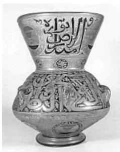
(Fig. 3) Miskah en verre émaillé, au nom de Sayhu al-Nasiri, vers 756/1355, conservée au Musée d'Art Islamique du Caire, n° 328.

accompagnées de canards, de rosettes, de fleurs de lys et de lotus étaient probablement associées à des symboles solaires. Il est probable que ces motifs avaient des significations astrologiques et étaient utilisés pour leurs valeurs magiques et protectrices. 4