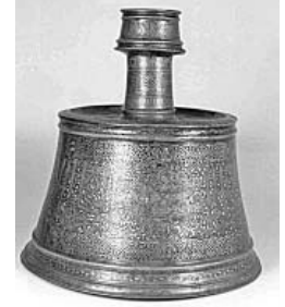
(Fig. 5) Chandelier en cuivre gravé incrusté d'or et d'argent daté du VII e /XIII e siècle, conservé au Musée d'Art Islamique du Caire, n° 15078.