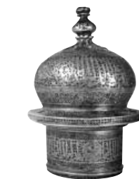
(Fig. 1) Lustre en cuivre ajouré au nom du sultan rasulid deYaman, al-Mu'ayad Dawud vers 765/1363, conservé au Musée d'Art Islamique du Caire, n° 15122.

C'est au début du VIII e /XIV e siècle qu'apparaît une nouvelle forme d'inscription : l'inscription circulaire aux hampes rayonnantes. 1 Ces inscriptions prennent la forme des rayons du soleil et parfois la forme de médaillons polylobés comme on l'a constaté sur quelques chandeliers conservés au Musée d'Art Islamique du Caire. 2 Elles étaient, dans d'autres cas, entourées d'une série de canards en vol comme constaté sur un chandelier conservé au Museum of Fine Arts à Boston, 3 ou bien d'une série de différentes fleurs. Ces inscriptions aux hampes rayonnantes,