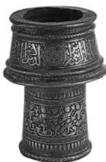
(Fig. 10) Chandelier en or incrusté d'argent, au nom de l'émir Kitbuga, daté de 690/1291, conservé au Musée d'Art Islamique du Caire, n° 4463.

avons constatées sur un seul chandelier figurant dans notre catalogue (Fig. 9).