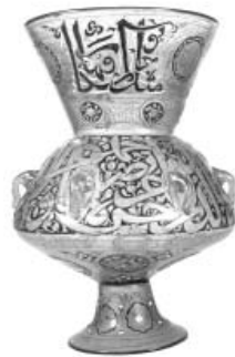
(Fig. 12) Miskah en verre émaillé, au nom du sultan Hasan, entre 756-762/1356-1361, conservée au Musée d'Art Islamique du Caire, n° 315.

D'ailleurs, il faut remarquer que la longueur du texte coranique était délimitée selon l'espace