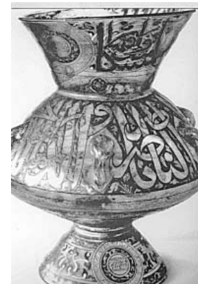
(Fig. 30) Miskah en verre émaillé et doré, au nom du sultan Hasan , entre 756-762/1356-1361, conservée au Musée de Victoria et Albert, n° 327-1900.