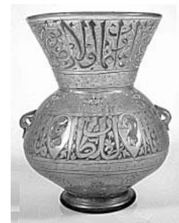
(Fig. 22) Miskah en verre émaillé, au nom du sultan Al-Nasir Muhammad ibn Qalawun, vers 698/1298-1299, conservée au Musée d'Art Islamique du Caire, n° 313.