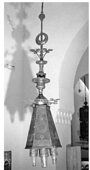
(Fig. 27) Lanterne en cuivre gravé et ajouré au nom de l'émir Qigmas vers 886/1481, conservée au Musée d'Art Islamique du Caire, n° 242.