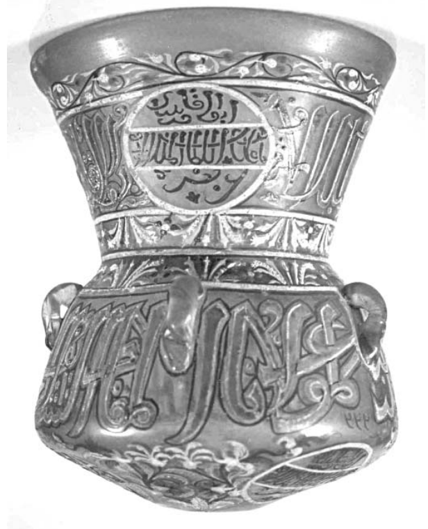
(Fig. 25) Miskah en verre émaillé et doré, au nom du sultan Qaytbay, vers 879/1474, conservée au Musée d'Art Islamique du Caire, n° 333.

qui porte le nom du sultan Al-Nasir Ahmad (Fig. 23).