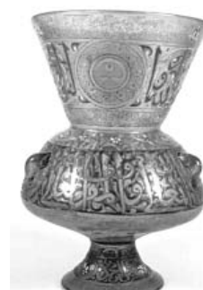
(Fig. 15) Miskah en verre émaillé, au nom de l'émir Ulmas al-Hagib, vers 730/1329, conservée au Musée d'Art Islamique du Caire, n° 3154.

disponible sur la lampe. Le texte ne s'arrêterait pas toujours au même endroit 16 : on lit jusqu'à misbah , sur la lampe de Sayhu al-Nasiri (Fig. 3) ; jusqu'à al-misbah , sur les lampes du sultan Hasan (Figs. 12, 13) ; jusqu'à zugaga , sur la lampe de Qawsun (Fig. 14) ; jusqu'à al-zugaga , sur la lampe de l'émir Ulmas al-Hagib, (Fig. 15). et sur celle du sultan Barquq (Fig. 16) ; jusqu'à kawkab , sur la lampe d'Al-Nasir Muhammad ibn Qalawun et sur celle de Qani Bay al-Garkasi inscrit sur le col et sur la panse (Fig. 17).