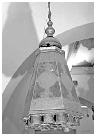
(Fig. 7) Lanterne en cuivre gravé et ajouré au nom du sultan Qaytbay, vers 901/1496, conservée au Musée d'Art Islamique du Caire, n° 383.