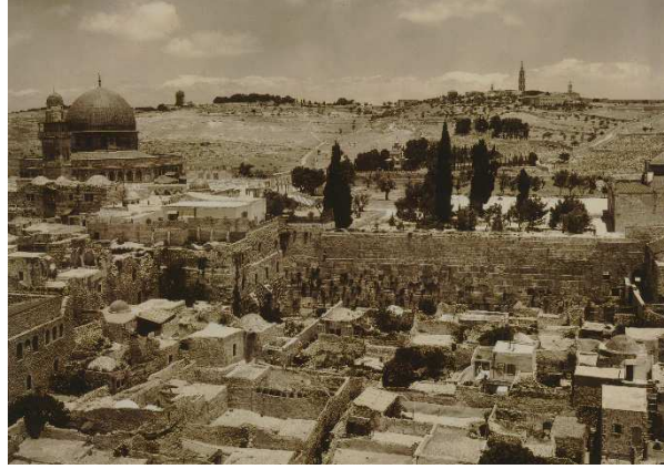
صورة رقم ١: حارة المغاربة قبل الهدم - عام ١٩٣٠

وعلى ضوء التغييرات الفكرية الحاصلة في العالم وظهور مدارس "ما بعد الحداثة" الاعتراف في تجنيد علم الآثار وخدمته للرواية الصهيونية ومنهم من ينادي اليوم بإزاله هذا التقييد والتجنيد الحاصل لعلم الآثار وان يعطى للبحث الاثري استقلاليته البحثية بعيدا عن الأجندة السياسية وقد بتنا اليوم نرى جمعيات يهودية تسعى لجعل علم الآثار اداة لتحقيق التعايش والتواصل بين اليهود والعرب والحفاظ على الوضع الراهن كما تفعل جمعية "عيمك شفيه" (١٣) على سبيل المثال (١٤) .