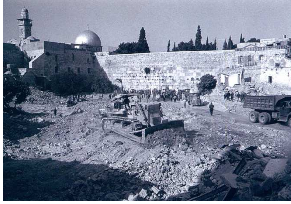
صورة رقم ٢: هدم حارة المغاربة على اثر احتلال القدس - عام ١٩٦٧