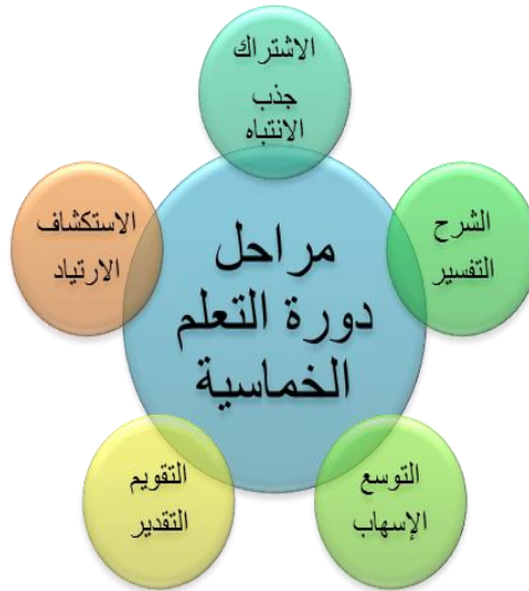
شكل (٢): مراحل دورة التعلم الخماسية

ويوضح الشكل (٢) المراحل الخمس لدورة التعلم الخماسي (من تصميم الباحثة):