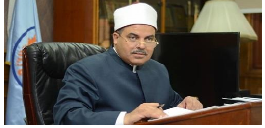
فضيلة أ.د: محمد حسين المحرصاوي رئيس جامعة الأزهر