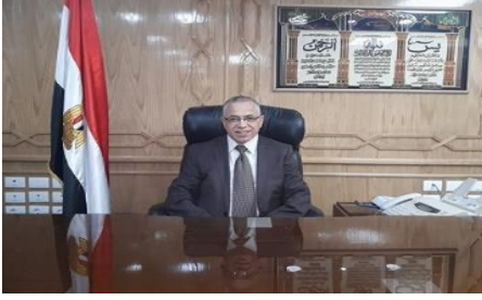
فضيلة أ.د: طارق سليمان نائب رئيس الجامعة للدراسات العليا والبحوث