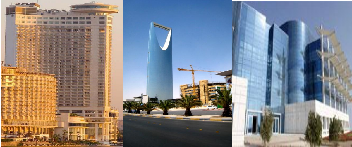
فندق جراند حياة بالقاهرة