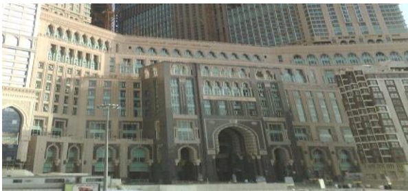
وقف الملك عبد العزيز بمكة المكرمة