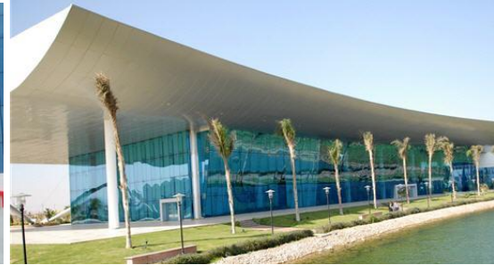
القرية الذكية بالقاهرة

شكل (٣): أمثلة لأزمة الهوية وتأثير الاغتراب الثقافي على العمارة العربية المعاصرة