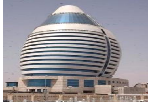
فندق الفاتح بالسودان