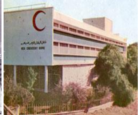
مبنى الهلال الأحمر بالعراق

شكل (٥): العمارة العربية والتأثر بالعمارة الغربية خلال فترة الحداثة