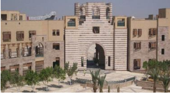
مجمع الجامعة الأمريكية بالتجمع الخامس