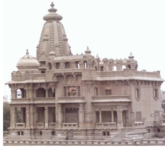
قصر البارون امبان بمصر الجديدة

شكل (٤): أبنية على النمط الهندي والغربي في حقبة التغيير في مصر في نهايات القرن التاسع عشر وبدايات القرن العشرين