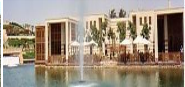
مقهى البحيرة بحديقة الأزهر

شكل (١١): محاولات تأصيل عمارة معاصرة عربية الطابع ذات شخصية معمارية متميزة من خلال الارتباط بالبيئة والتراث