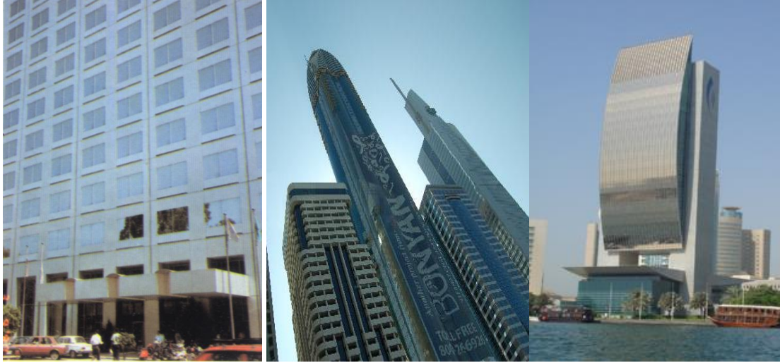
برج النيل بالجيزة