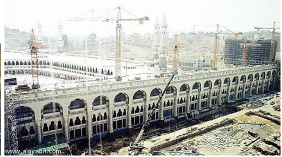
توسعة المسعى الجديدة بالحرم المكي