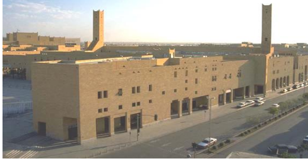
مباني قصر الحكم بالرياض