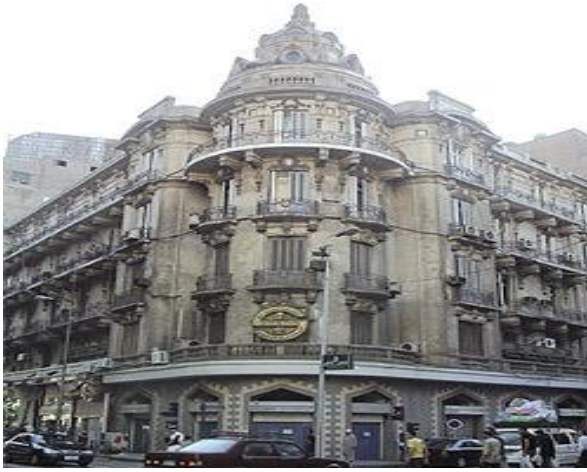
أحدى عمارات وسط البلد بالقاهرة

فقد كان نتيجة لاعطاء المدينة الغربية الطرز الأفضلية والنظر إليها على أنها الأكثر تحضراً , إلى النظر إلى البيئة التقليدية على أنها بيئة متخلفة , والغالب أن هذا هو كان التفكير السائد في حقبة التغيير (النصف الثاني من القرن التاسع عشر) في المدن العربية حيث أهملت البيئة التقليدية تماماً , وإبراز