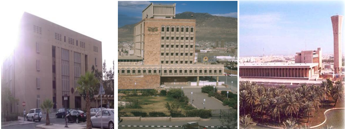
شكل (٦): نماذج لجامعات بالسعودية والبنك المركزي بصنعاء خلال مرحلة ما بعد الحداثة

فقد ظهرت أنماط معمارية مختلفة في الجزيرة العربية بعد الطفرة البترولية فيها وحركة الهجرة المكثفة إليها وذلك عن طريق المشروعات الكبرى للعمارة الرسمية والتي استأثرت بمعظمها المعماري الأجنبي الذي لم يجد أمامه أى محددات اقتصادية أو أي قيود فنية، فانطلق بكل ما لديه من فكر معماري وإنجاز تكنولوجي ليصمم هذه الصروح الكبيرة من الأعمال المعمارية التي شهدتها المنطقة في العمارة الرسمية مثل البنوك والفنادق والمباني العامة ومباني السيادة ومباني الخدمات