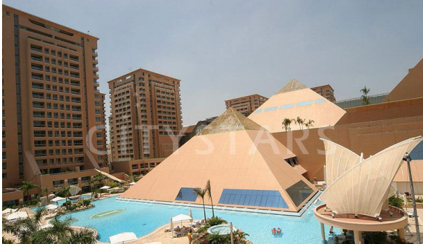
مجمع سيتي ستارز الفندقى بمصر الجديدة

وشكل اتجاه ما بعد الحداثة أكثر التيارات وضوحا في العمارة العربية المعاصرة وذلك عن طريق إعادة احياء التاريخ او " التأرخه " إذا جاز التعبير , ويتجلي هذا في تصريحات العديد من المعماريين الذين يصرون علي ان محاكاة التاريخ في المباني المعاصرة يعمل علي خلق احساس بالانتماء بوضر الروابط العاطفية بين المجتمع والبيئة المبنية من حوله , وبالتالي تنتشر النقل من التراث المعماري العربي الغني بالمفردات. [٢٤] (شكل: ٩)