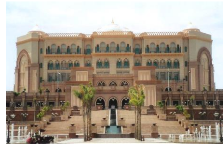
فندق قصر الامارات بأبوظبي