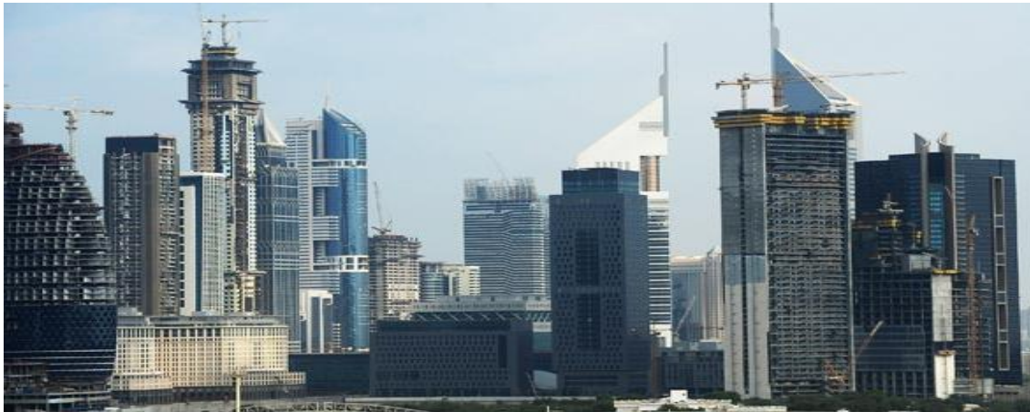
ناطحات السحاب بدبي وكأئك فى مدينة نيويورك الأمريكية

وكنتيجة مباشرة فقد أصبح المشهد الحالي للعمارة العربية المعاصرة يضم في بعض جوانبه عدد من الظواهر السلبية من أهمها التبعية المطلقة في بعض الأحيان للاتجاهات العالمية والتي تتمثل في النقل المباشر للاتجاهات المعمارية العالمية المعاصرة مثل النزعات التشكيلية والتعبيرية في عمارة ما بعد الحدائى التي أعطت بعض الحرية في انتقاء أشكال العناصر التراثية تماشياً مع الاتجاه الفكري العام المسائر للثقافة السائدة خلال ثمانينيات القرن العشرين, وأيضا التأثير بالنزعات والاتجاهات التفكيرية للعمارة العالمية المعاصرة [٢٧], وإعادة انتاج هذه الاتجاهات المعمارية العالمية بمعالجات شكلية واقتباسات سطحية أو ساذجة في معظم الأحوال وبغض النظر عن السياق الثقافي والاجتماعي الذى ظهرت فيه هذه الاتجاهات أو مراحل تطورها أو الظروف المحلية التى ستحتويها دون أى محاولة "لتعريبها" للتفاعل مع الظروف المحيطة أو التقنيات المتاحة, مما يجعلها منفصلة عن السياق المحلى , كما تتمثل هذه