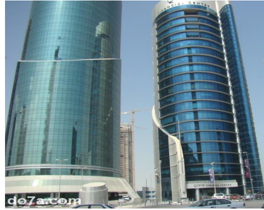
مباني وناطحات سحاب معاصرة فاقدة للهوية المعمارية العربية بالسودان ودبي وقطر