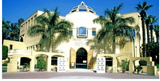
قصر الفنون بالجزيرة