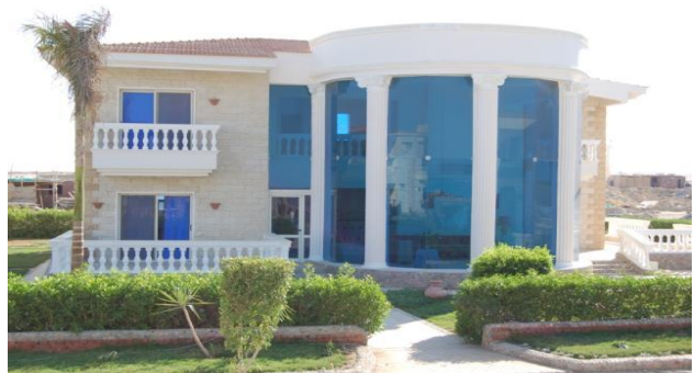
شكل (٨): نماذج لقصور وفيلل مصرية معاصرة على الطراز الكلاسيكي الغربي وطراز عصر النهضة

لههدف مقصود أو نتيجة الجهل بخصوصيات هذه التوجهات. [٢٢]