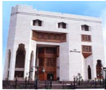
دار الإفتاء بالقاهرة