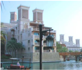
سوق الجميرة بدبي