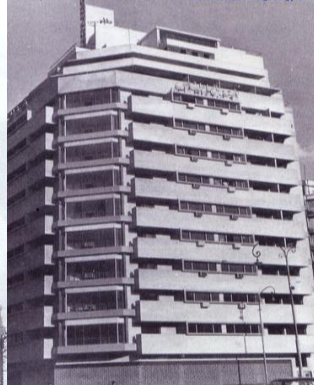
فندق أطلس بالقاهرة