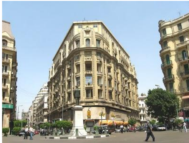
شكل (١): مباني وسط القاهرة توضح التأثير بالعمارة الغربية أثناء فترة الاحتلال

فلقد أصبحنا نعيش فى عصر التفاعل بين ما هو عالمى وما هو محلى، فوجدنا النموذج الغربى للعمارة بكل ملامحه وخصائصه يسود تارة، وتارة أخرى نجد العمارة التراثية يتم استنساخها ونحن فى مطلع القرن الحادى والعشرين، وأخيراً نجد فكراً متوازناً يحمل عبق الماضى وفى الوقت ذاته يقدم عمارة بمفهومها المتطور حيث يساهم هذا التوجه أو الفكر فى تخفيف وطأة الاغتراب، بل ويؤدى إلى إيجاد هوية متحركة ذات عمق ثقافى وبعد حضارى يعالج من خلالها أزمة اللجوء إلى استيراد الأنماط الغربية والصيغ الجاهزة والانجراف وراءها لحل مشكلات البيئة العمرانية العربية.