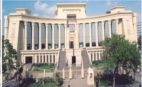
المحكمة الدستورية العليا بالمعادي