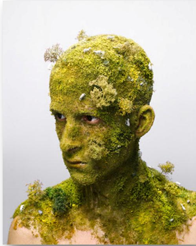
منحوتات بيولوجية نباتية