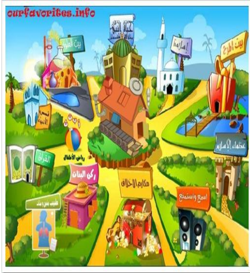
الشكل رقم ( ٤ ) ( موقع بنين وبنات للقصص التفاعلية )