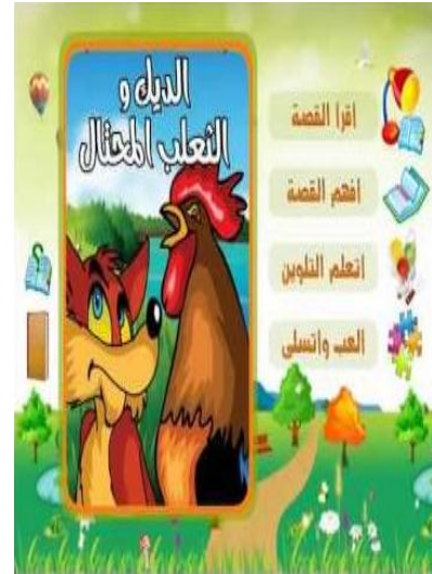
الشكل رقم ( ٣ ) ( قصة الديك والثعلب المحتال قصة تفاعلية )