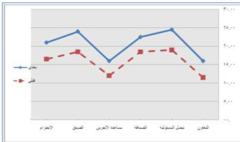
شكل (٢) يوضح قيم الوسيط للمجموعة التجريبية في القياسين القبلي والبعدي للقيم الاجتماعية

كما يوضح الرسم البياني التالي قيم الوسيط لعينة الدراسة في القياسين (القبلي، والبعدي) للقيم الاجتماعية