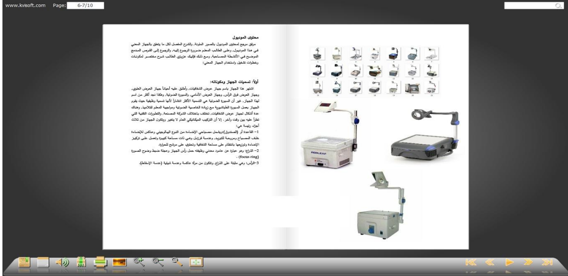
شكل (٢) نماذج من الصور الواقعية التي تم استخدامها بالكتاب الإلكتروني.

٢-٤-١ صور واقعية مع الطلاب مرتفعي التعقيد: في هذه المعالجة تم تصميم المحتوى في شكل كتاب إلكتروني، بحيث يتم عرضه في شكل صور واقعية تعرض الأجهزة التعليمية بكل تفاصيلها الحقيقية دون استبعاد أو إضافة لأي جزء من هذه التفاصيل، والشكل (٢) التالي يوضح نموذج للصور الواقعية التي تم استخدامها داخل المعرض لجهاز عرض فوق الرأس.