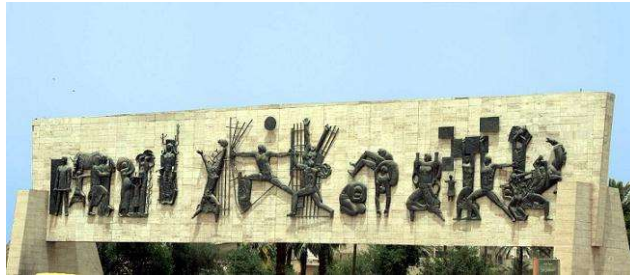
الفنان جواد سليم