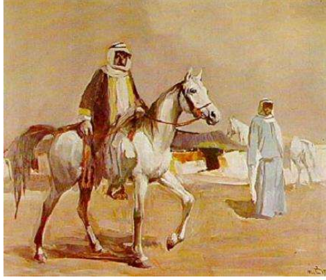
الفنان فائق حسن