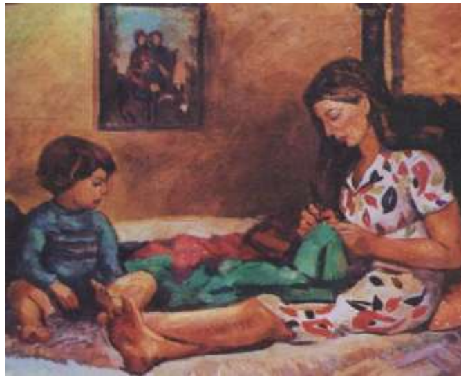
الفنان عيسى حنا