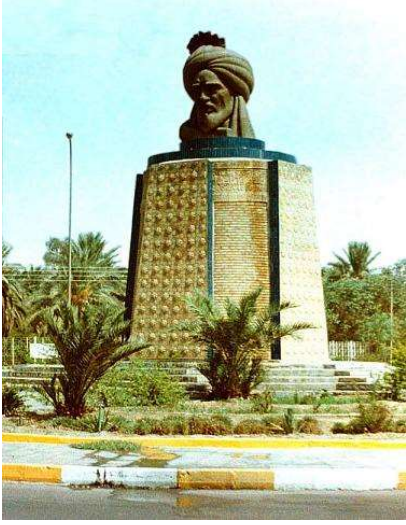
الفنان خالد الرحال