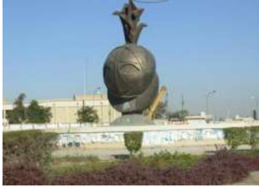
الفنّانة ميران السعدي