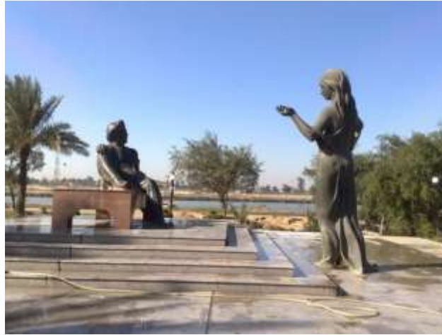
الفنان محمد غني حكمت