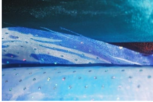
الشكل رقم (٤): أمواج، فخرية ابيحائية، قماش حريري، ٦٥ سم X ٨٠ سم، 2008.