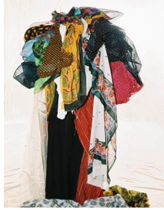
الشكل رقم (٨): عالية، فخرية البيحانية، قماش حريري، ٦٥ سم X ٨٠ سم، 2008.