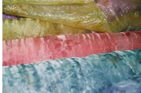
الشكل رقم (١)، تراكم، ٦٥ سم * ٨٠ سم * ٨٠ سم، قماش حريري، ٢٠٠٨.