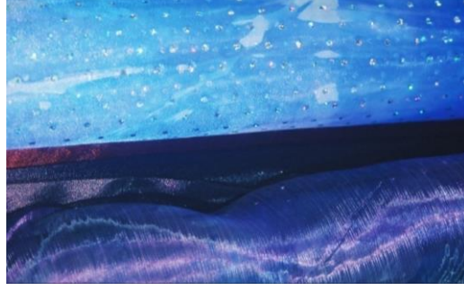
الشكل رقم (٣): انسياب، فخرية ابيحائية، قماش حريري، ٦٥ سم X ٨٠ سم، 2008.