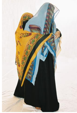
الشكل رقم (٦) والشكل رقم (٧): نصره ونقاء، فخرية البيحانية، قماش حريري، ٦٥ سم X ٨٠ سم، 2008.