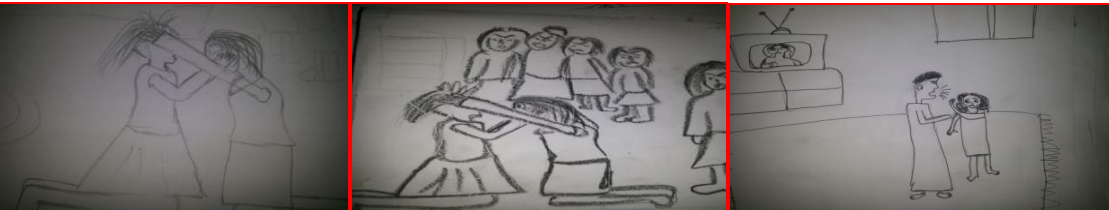
شكل (٥٢) مرحلة أعدادية "شتائم الأب لابنته" شكل (٥٣) مرحلة الأعدادية "ضرب الأخت لأختها" شكل (٥٤) مرحلة الأعدادية "ضرب الأخت لأختها"