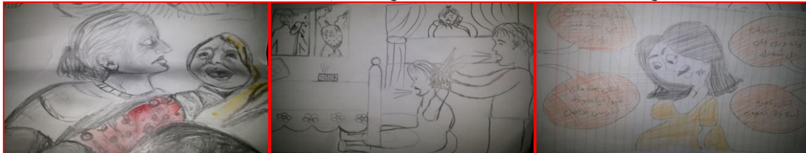
شكل (٢٥) مرحلة أعدائية "العنف اللفظي" شكل (٢٦) مرحلة أعدائية "شد الشعر" الأخ " شكل (٢٧) مرحلة أعدائية "ضرب زوجة الأب" الأب "