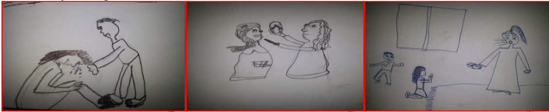
شكل (١) مرحلة أعدادية "ضرب بالحذاء" "الأم" شكل (٢) مرحلة أعدادية "شد الشعر" "الأخ"