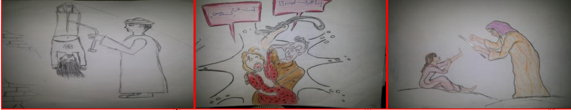
شكل (٦) مرحلة أعدادية "الضرب بالعصا" "الأم" شكل (٧) مرحلة أعدادية "الضرب بالحزام" "الأم" شكل (٨) مرحلة أعدادية "الضرب بالحزام" "الأب"