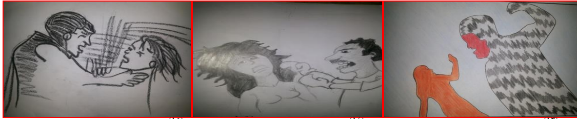
شكل (١٣) مرحلة ثانوية "لكم الوجه" الأب " شكل (١٤) مرحلة ثانوية "لكم الوجه" الأب " شكل (١٥) مرحلة ثانوية "خنق" الأخ "