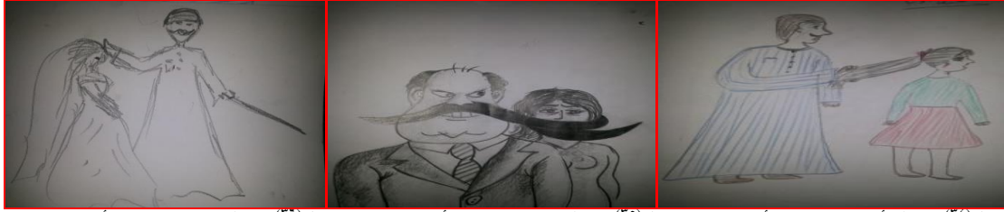
شكل (٣٤) مرحلة أعدادية عنف الأب" شكل (٣٥) مرحلة ثانوية "عنف الأب" شكل (٣٦) مرحلة ثانوية "عنف الأب"

شكل (٣١) مرحلة أعدادية "تكسير الأطباق" زوج الأم" شكل (٣٢) مرحلة ثانوية "تحرش الأقارب" شكل (٣٣) مرحلة ثانوية "تكسير الموبيل" العم"