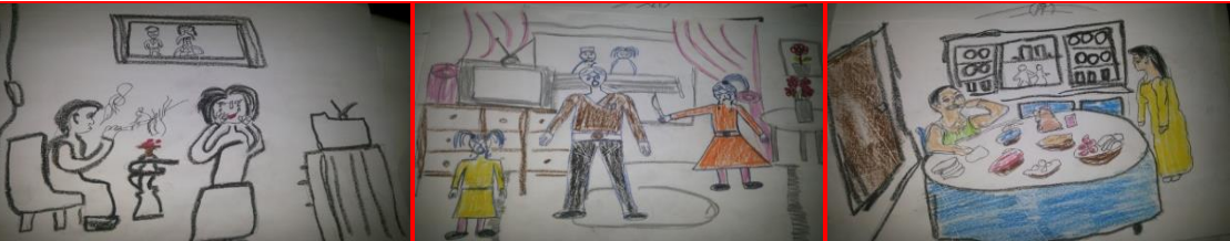
شكل (٤٩) مرحلة ثانوية "فرض خدمة لاخته تميز" شكل (٥٠) مرحلة ثانوية "تهديد الاخت لأختها بالسكين" شكل (٥١) المرحلة الأعدادية "تضرر البنيت من الدخان"