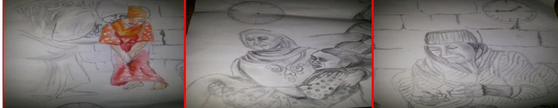
شكل (١٦) مرحلة ثانوية "خنق" جدة قابلة " شكل (١٧) مرحلة ثانوية "خنق" عمه " شكل (١٨) مرحلة ثانوية "خنق" ختان " الأم "