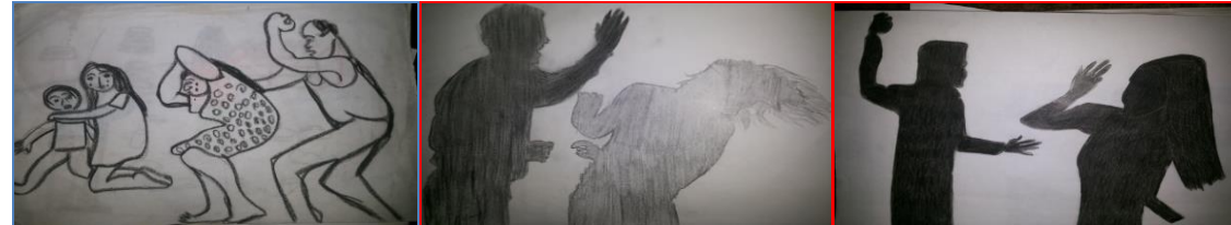
شكل (٩) مرحلة ثانوية "صفع الوجه" "الأب" شكل (١٠) مرحلة ثانوية "صفع الوجه" "الأب" شكل (١١) مرحلة ثانوية "لكم الظهر" "الأب"