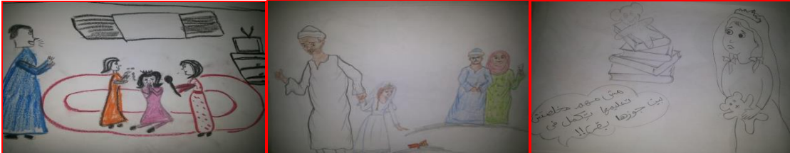
شكل (٤٠) مرحلة ثانوية "الزواج المبكر للإناث" شكل (٤١) مرحلة أعدادية "الزواج المبكر للإناث" شكل (٤٢) عنف الأب والأم معا مرحلة أعدادية"