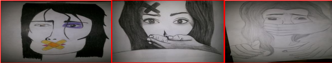
شكل (٤٣) مرحلة ثانوية "غلق الفم باليد" اكنم التنفس" شكل (٤٤) مرحلة ثانوية "غلق الفم باليد وأصابة الجبهة" شكل (٤٥) تعبير رمزي لغلق الفم وأصابة العين