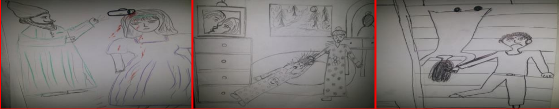
شكل (٣) مرحلة أعدادية "سحب من الشعر" "الأم" شكل (٤) مرحلة أعدادية "سحب من الشعر" "الأخ" شكل (٥) مرحلة أعدادية "القفز بكوب الشاي" "الأب"