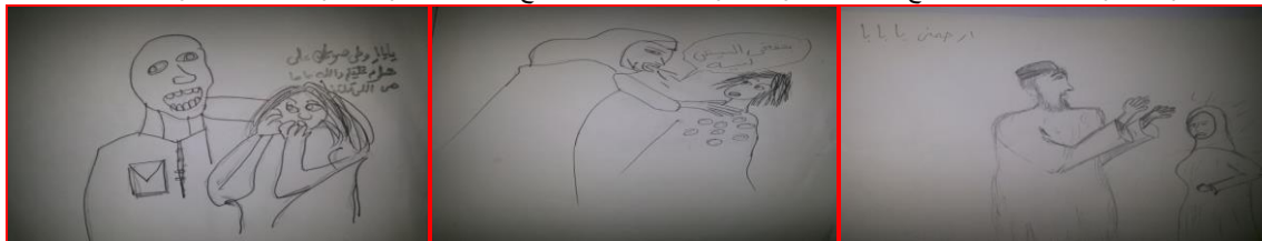
شكل (٢٢) مرحلة أعدائية "صنع الوجه" الأب " شكل (٢٣) مرحلة أعدائية "صنع الوجه" الأم " شكل (٢٤) مرحلة أعدائية "شد الشعر" الأب "