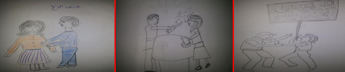
شكل (٤٦) مرحلة ثانوية "ضرب الاخوة الذكور للإناث" شكل (٤٧) مرحلة ثانوية "ضرب الوجه بالماء من الاخ" شكل (٤٨) المرحلة الأعدادية "ضرب الاخ لأخته"