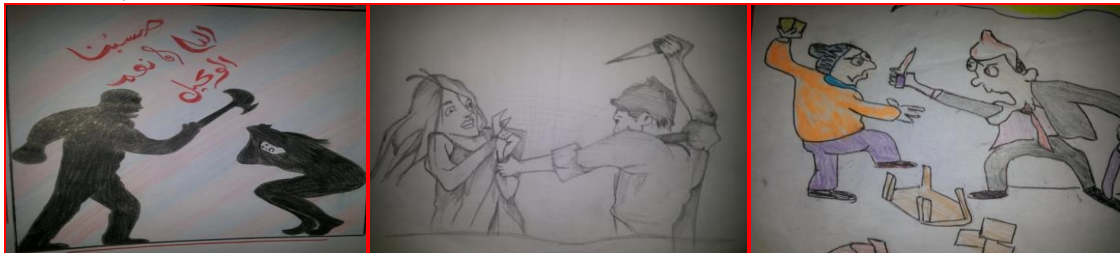
شكل (١٩) مرحلة ثانوية "تهديد بالسكين" الأخ " شكل (٢٠) مرحلة ثانوية "تهديد بالسكين" الأخ " شكل (٢١) مرحلة ثانوية "تهديد بالشاكوش" الأب "