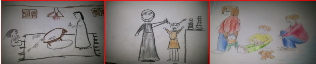
شكل (٣٧) مرحلة أعدادية "تميز الذكور" شكل (٣٨) مرحلة ثانوية "شد الشعر" شكل (٣٩) مرحلة ثانوية "قلب الطعام"