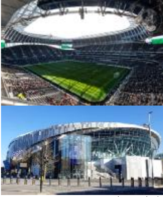
شكل ٢ ملعب White Hart Lane

فيما يتعلق بالحركة ، تربط المنطقة الواسعة القابلة للتجول في Sports Hub مباشرة بشبكات المشاة والدراجات المحلية وبنظام موصل الحديدية على مستوى الجزيرة بسنغافورة ، سقف قابل للطي ومقاعد متحركة متعددة المستويات، يتم التحويل من وضع إلى آخر خلال ٤٨ ساعة.(٨)