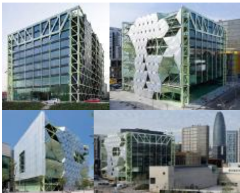
شكل ٤ Media Tic Building