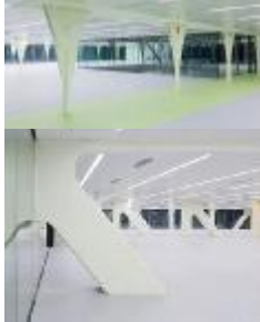
شكل ٥ الهيكل الإنشائي ل Media Tic Building