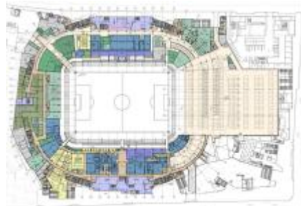
شكل ٣ الحركة في أرضية ملعب White Hart Lane الجديد المصدر :

تم تغطيته بالكسوة المعدنية مثل تلك المخططة في البداية ، على الرغم من أنها في شكل محدث من فسيقساء حزام مثقبة. و يتم إنشاء سطح عرض أعلى الملعب ، يسع الملعب ٦٢٠٠٠ مشجع ، الميزة الأكثر تميزاً في ملعب توتنهام هوتسبر هي منصة ساوث ستاند التي تبلغ سعتها ١٧٥٠٠ ، وهي أكبر منصة في المملكة المتحدة ، صمم Populous الحامل الجنوبي للمساعدة في إنشاء "جدار للصوت" داخل الاستاد والمساعدة في خلق شعور فريد مميز على الأرض ، أسفل المدرج الجنوبي يوجد ردهة زجاجية بارتفاع خمسة طوابق مع عمودين كبيرين يشبهان الأشجار يدعمان الهيكل ، هذه المنطقة التي تسمى The Market ، عبارة عن قاعة طعام ومشروبات كبيرة تحتوي على بار بطول ٦٥ مترًا الغرض منها استخدامها كمكان تجمع قبل وبعد المباريات ، وكذلك يتم فتحها في المناسبات المختلفة.