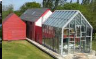
شكل ٦ البيت المنزلق Sliding House المصدر :