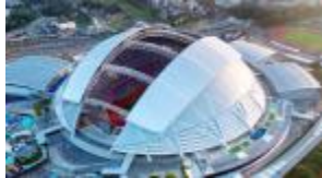
شكل ١ مركز سنغافورة الرياضي Singapore Sports Hub .