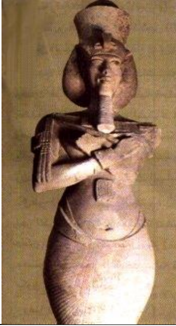
شكل رقم (١٠)