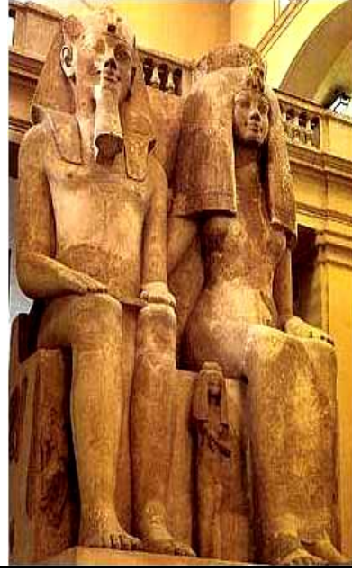
شكل رقم (٩)

الدولة: الحديثة الأسرة: الثامنة عشر إسم العمل الفني: الملك أمنحوتب الرابع " إخناتون " الخامة: الحجر الصلد