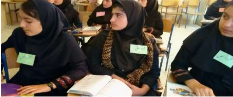
الشكل الثاني: تكوين الفرق على أساس موضوع الدرس

يمكن للمعلم أن يكون مبدعاً في تكوين المجموعات والقيام بالعمل الجماعي؛ إنّ إحدى طرق الإبداع في هذا المجال هي تكوين المجموعات الدراسية على أساس موضوع الدرس. على سبيل المثال، في تدريس موضوع الجمل الإسمية والفعلية، يستطيع المعلم أن يسمّي أسماء المجموعات بالمبتدأ والخبر والفعل والفاعل. جاء الباحثة بالصورة التي تدلّ على استخدام هذا الأسلوب في الصف العاشر من تلقاء نفسها.