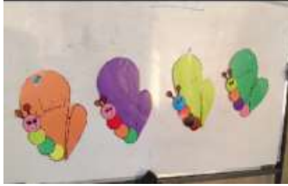
الشكل العاشر: رتب الجمل

سبيل المثال، الجملة المكتوبة على الأشكال في الصورة أدناها، تدلّ على قاعدة من قواعد الفعل المبني للمجهول، كلماتها هي: يُحَدَفُ، فاعِلٌ، فعلٌ، المجهول.