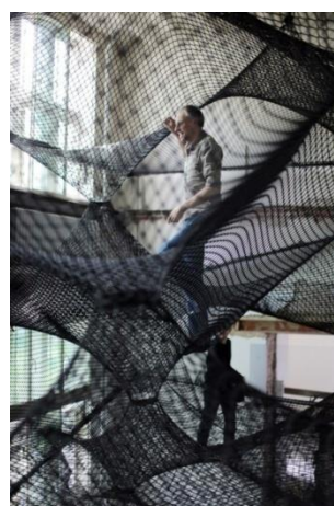
شكل ( ١١ ب )