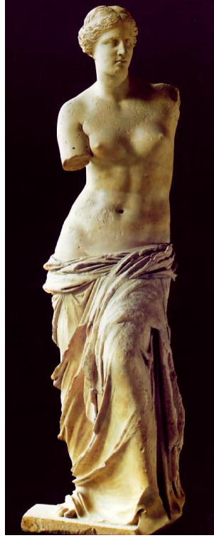
شكل ( ٢ )