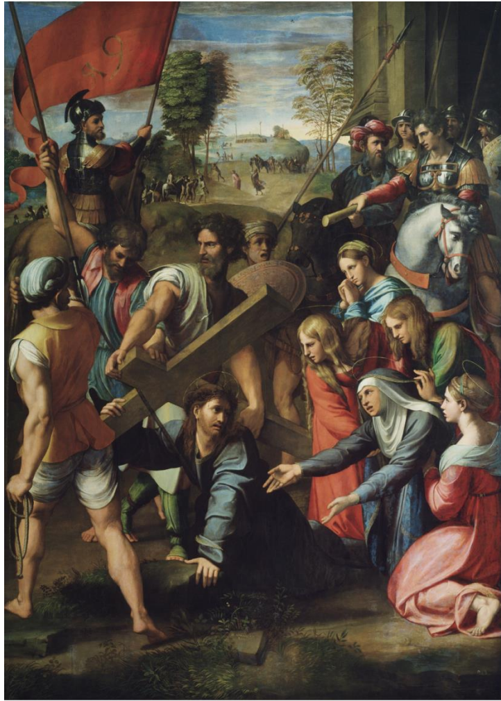
شكل ( ٣ )

للجميع كفنون عصر النهضة ، فقصص المسيح و المسيحية كديانة سماوية هي من محفوظات البشرية و التي لا يمكن أن تزول ، كما أن البناء الفني المدروس و الحالة الانفعالية و مهارة التصوير جعلت من تلك الأعمال خريطة للفن التشكيلي العالمي عبر العصور ، بينما الجمال كموضوع بطبيعته متغير و نسبي من مجتمع لآخر و من حقبة زمنية لآخري ، كذلك فكرة تجسيد الألهة التي اندثرت بوجود الديانات السماوية ، فتلك الفنون مثلت زوال الإلزام و دوام الالتزام ، فقد زال الألتزام الكنسي بالقواعد الصارمة و دام التزام الفنان بقدسية التعبير الديني و التزام المتلقي بتقبله و احترامه .