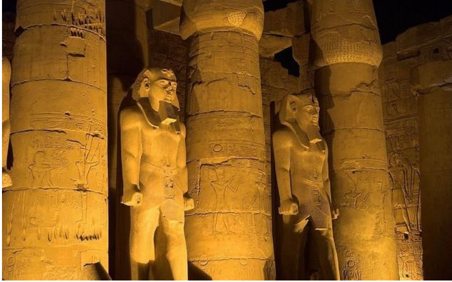
شكل ( ١ )

و هذا ما يظهر في تكوين معبد الأقصر- شكل ( ١ ) - كنموذج للمعابد الشامخة حتى وقتنا هذا بعد مرور آلاف الأعوام ، بسبب بناءه بالأحجار الأكثر صلابة ، و تقنية نحت تماثيله العملاقة التي حافظت عليه من عوامل التعرية ، فهو معبد " أمون و زوجته و أبنه " الذي يحوي تماثيلهم التي ستعود إليها أرواحهم بعد البعث ليحيوا حياة الخلود الدائمة .