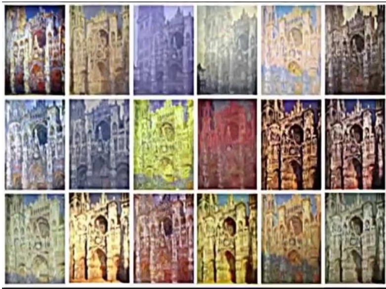
شكل ( ٤ )

كان هدف الفنان الانطباعي هو التعبير عن الجمال الزائل العابر ، جمال اللحظة الذي يتحول في لحظة تالية لجمال آخر ، فقد حاول الفنان اقتناص اللحظة الزائلة و حبسها في عمل فني دائم الوجود ، فعلاقة الطبيعة بالفن " هي علاقة العالم الطبيعي الزائل بذلك العالم الإنساني الذي يلتمس الخلود عبر الصور المخلوقة " ٢ .