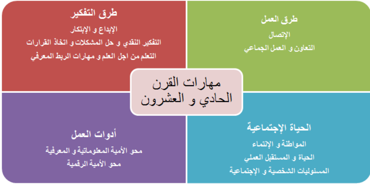
شكل رقم (٢) توضيحي لمهارات القرن الحادي والعشرون

والعشرين نجد اننا بحاجة الي وحدة قياس وهى التقييم لكي يؤتى هذا الدمج ثماره لانتاج منهج متكامل ومعاصر