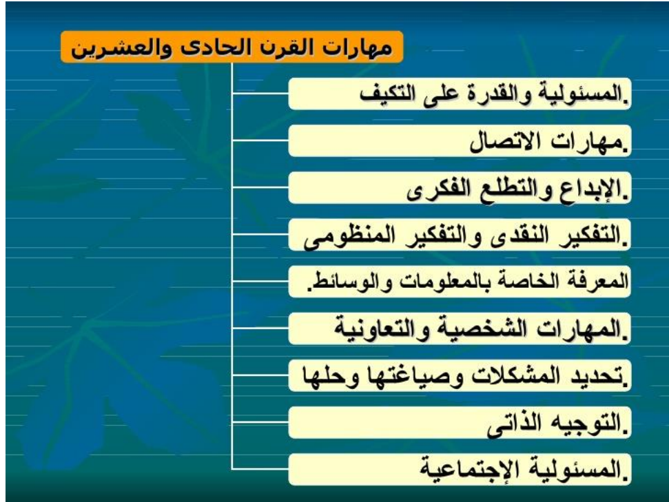
شكل رقم (٣) يوضح ما تأكد عليه الباحثة من مهارات لاعداد مناهج معاصر