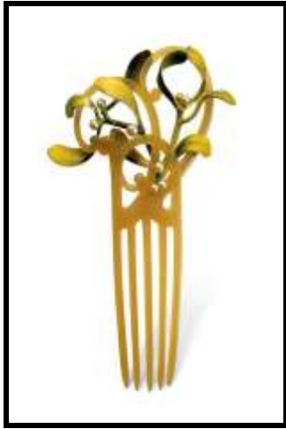
شكل ( ٥ )