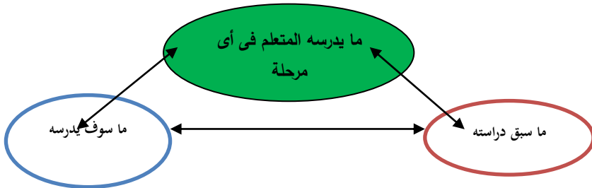
شكل (٢) الفكرة المنظومية فى التدريس والتعلم (٧: ٤)

وفى سياق متصل يؤكد "أمين فهمى وجولاجوسكى" (٢٠٠٠م) أن المدخل المنظومى يستخدم فى التدريس والتعلم حيث يقصد به دراسة المفاهيم أو الموضوعات من خلال منظومة متكاملة تتضح فيها كافة العلاقات بين أى مفهوم أو موضوع وغيره من المفاهيم أو الموضوعات مما يجعل المتعلم قادراً على ربط ما سبق دراسته مع ما سوف يدرسه فى أى مرحلة من مراحل الدراسة من خلال خطة محددة وواضحة لإعداده فى منهج أو تخصص معين، ويتضح ذلك من الشكل المنظومى التالى :