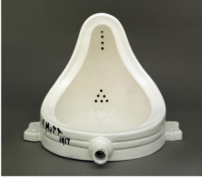
مارسيل دوشامب - النافورة-بورسليين ١٩١٧- ٦١ سم - متحف الفن الحديث - نيويورك ٢

للرجال من الخزف الصيني تحت عنوان "نافورة" لكنها عندما عرضت مرة أخرى في أواخر الخمسينات، لم يتبق أي أثر للصدمة الأولى" ١