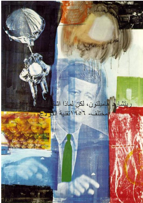
ريتشارد هاميلتون، لكن لماذا اشك مختلف - 1956 تقنية الكولاج