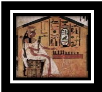
شكل (١ - ب)

• إقامة معارض متنقلة لبعض تصميم الأعمال الفنية لبعض الألعاب والفنون المجتمعية في دلتا مصر التي تتميز بالتعبيرية الحضارية تستهدف تعريف شعوب العالم بمجتمعاتنا، وما تحوزه من ثراء حضاري وبما ينعكس في فنوننا الإنتاجية، وتوفير سوق عالمية واسعة لها.