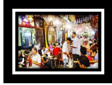
شكل (ت) ٢ الخيمة الرمضانية تعد ملتقى العائلات التي تسهر في الجو الرمضاني