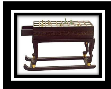
شكل (١ - أ)

لعبة السنت الخاص "بتوت عنخ أمون بقوائم أبانوس