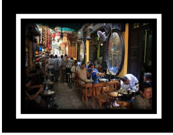
شكل (ث) ٢ للمقاهي دور بارز في عمل الخيم الرمضانية ذات الطابع الشعبي