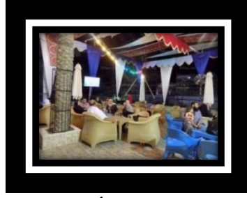
شكل (أ) ٢ يتضمن برنامج الخيم الرمضانية التي تمتد سهراتها حتى السحور التواشيح الدينية