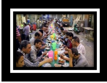
شكل (ج) ٢ موائد الرحمن والتكافل الاجتماعي من مظاهر الشهر الكريم