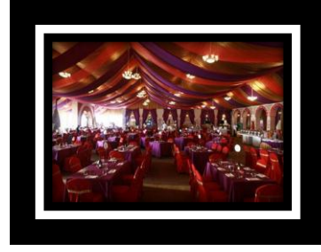
شكل (٢) ٢ الخيمة الرمضانية التي أضحت من السمات المميزة لشهر رمضان الكريم