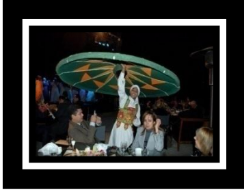
شكل (ب) ٢ راقص التنورة في الخيم الرمضانية بالأندية لاضفاء الطابع الشعبي