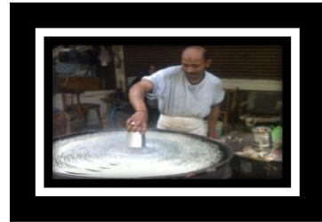
شكل (ح) ٢ عمل الكنافة والتي حظيت بمكانة مهمة في التراث الشعبي المصري