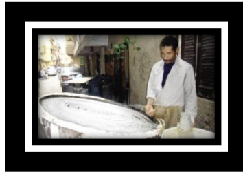
شكل (خ) ٢ كنفاني ومهنة طوال الشهر الكريم بفرن مؤقت أمام منزله بالمناطق الشعبية وطرق تسويتها