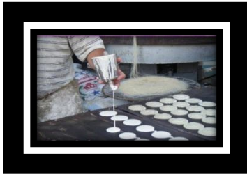
شكل (د) ٢ لا تزال القطايف من عناصر فولكلور الطعام في مائدة شهر رمضان