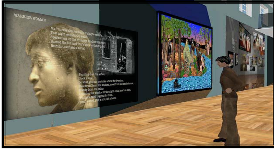
شكل ( ٥ ) جولة لمعرض الفن والموسيقى بجامعة شيكاغو

بحيث يمكنه التجول بحرية من خلال أدوات الجولة، وتعتمد هذه الجولة في بنائها على نظم الواقع الافتراضي، وتعتبر من أكثر أنواع الجولات تكلفة في إنتاجها، ولكن الفائدة التي تعود منها تعوض هذه التكلفة. والشكل التالي يوضح جولة لمعرض الفن والموسيقى بجامعة شيكاغو