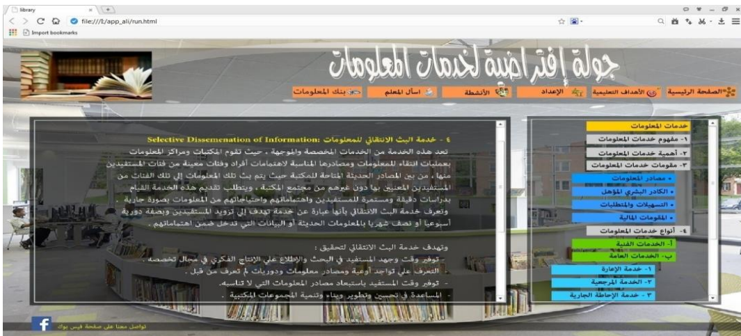
شكل (٧) أداة المحتوى النصي المستخدمة في نموذج الجولة الافتراضية

هذه الأداة من الأدوات المهمة الموجودة بموقع الجولات الافتراضية حيث يتم من خلالها تقديم المحتوى النصي لكل جولة من خلال الضغط عليها