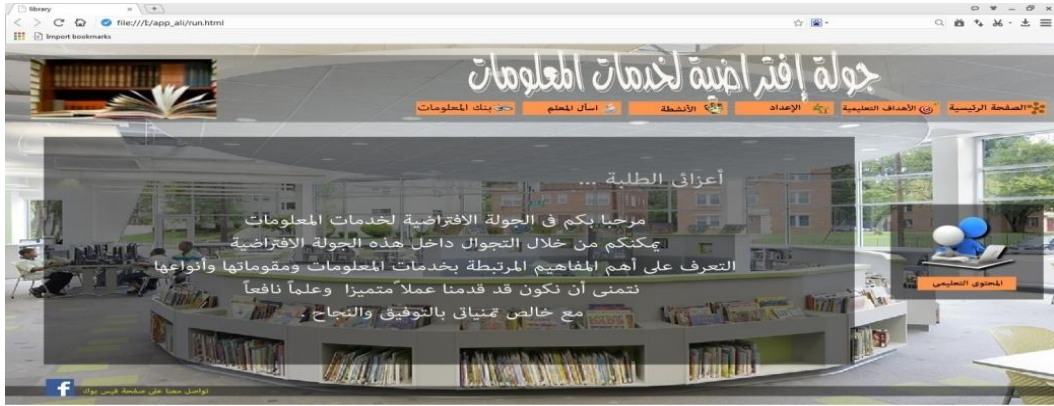
شكل (٦) واجهة التفاعل الخاصة بنموذج الجولة الافتراضية

تعد واجهة التفاعل الخاصة بالموقع هي أول ما يراه المتعلم؛ لذلك فقد تضمنت مجموعة من الوسائط المتعددة، مثل: الصور والنصوص وغيرها، وتتكون الصفحة الرئيسية لموقع الجولات