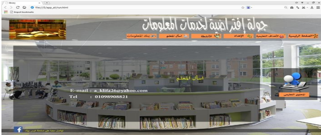
شكل ( ٨ ) صفحة اسأل المعلم المستخدمة في نموذج الجولة الافتراضية

متاحة للمتعلم في أي وقت بحيث يستطيع التواصل مع المعلم حالة وجود أي استفسار أو أي مشكلة . والشكل التالي