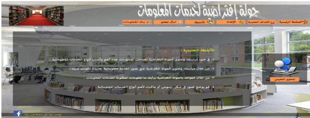
شكل (٩) صفحة الأنشطة التعليمية المستخدمة في نموذج الجولة الافتراضية

قام الباحث بتصميم هذه الأداة لتقديم مجموعة من الأنشطة التي تتم داخل الجولة حيث يقوم المتعلم بتنفيذ هذه الأنشطة وإرسالها إلي المعلم وتحتوي علي مجموعة متنوعة من الأنشطة الخاصة بخدمات