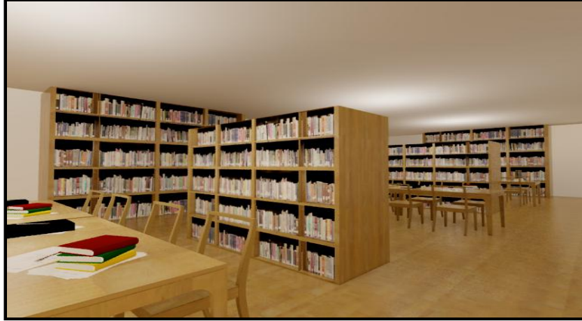
شكل (٣) جولة افتراضية ثلاثية الأبعاد

يكون لديه القدرة على التحكم في عناصر الجولة، وتتميز بأنها توفر للمتعلم رؤية بعض العناصر بطريقة قد لا تكون متاحة في البيئة الحقيقية، وكذلك تعمل على إثارة اهتمام المتعلمين. والشكل التالي يوضح جولة افتراضية ثلاثية الأبعاد.