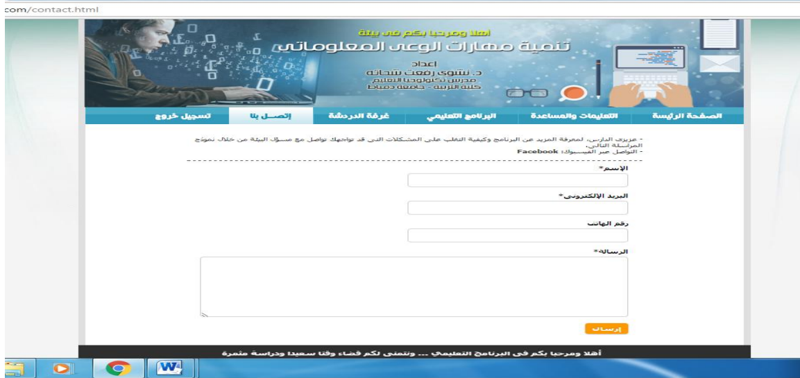
شكل (٣) يوضح تصميم نموذج التفاعل بين الباحثة والطلاب ببيئة التعلم

لإتاحة التواصل بين الطلاب وبعضهم تم تصميم "غرفة دردشة" وربطها ببيئة التعلم من خلال أيقونة خصصت لذلك. وللتواصل مع الباحثة تم