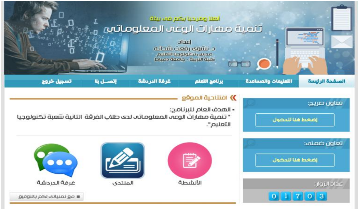
شكل (٢) يوضح واجهة تفاعل بيئة التعلم