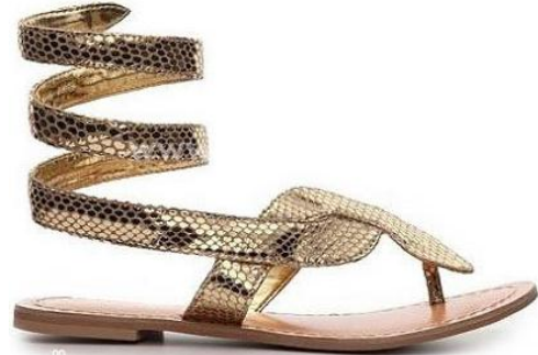
ملابس عصريه مستوحاه من ملابس المرأه في الحضاره المصريه القديمه ( الاشكال من ٣٢ : ٣٧ )