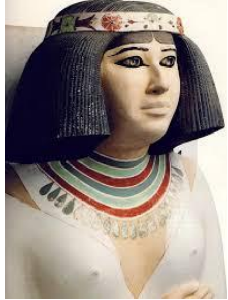
تمثالي نفرت وحاملة القرايين ( الاشكال من ٢٩ : ٣١ )