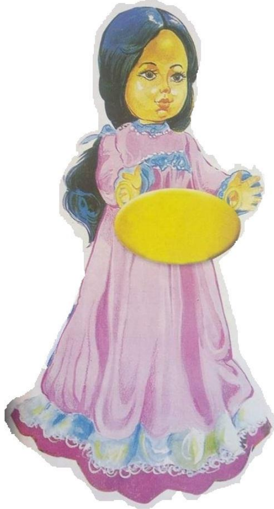
( شكل رقم ٢٧ )

طفله في العاشره من عمرها ، طولها ٣٠ سم ، خمريه اللون ، عيناها سوداء واسعه ، شعرها اسود طويل ، ترتدي ملابس عصريه محتشمه ، معها ازياء متنوعه من مصر ( ريفي - صعيدي - نوبي - بدوي - بحري ) او من السودان او فلسطين او الخليج او المغرب .. الخ ( عبلة ابراهيم. ٢٠٠١ )