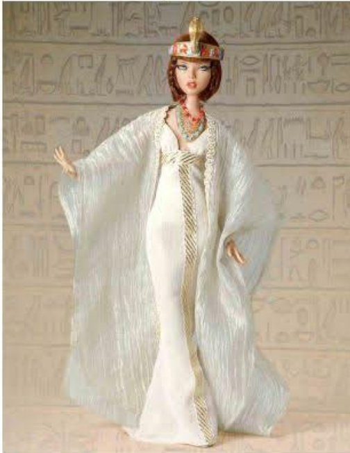
عروسة فرعونية سمراء، مميزة

واختيار الخامات الجيدة، والاهتمام بالشكل، يوضع العروسة في صندوق، وليس في كيس بلاستيكي، وتوفّر اكسسوارات مصاحبة لها، وملابس وأحذية. لأن هذه الأمور تجذب الطفل أكثر، ورحب بفكرة تصنيع العروسة الفرعونية.