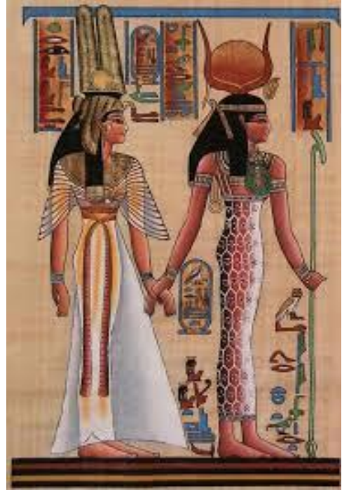
( الأشكال من ٦ : ٩ )