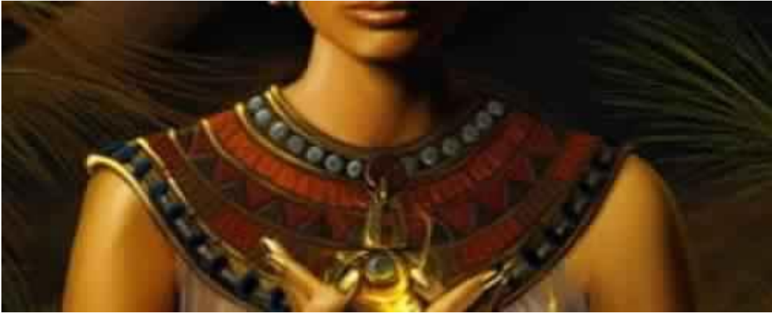
( الأشكال من ١٠ : ١٤ )