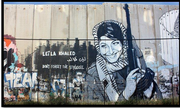
شكل 5: جرافيتي يصور المقاتلة ليلي خالد وعبارة "لا تنسوا الجهاد" على الجدار الفاصل بالضفة الغربية (1)