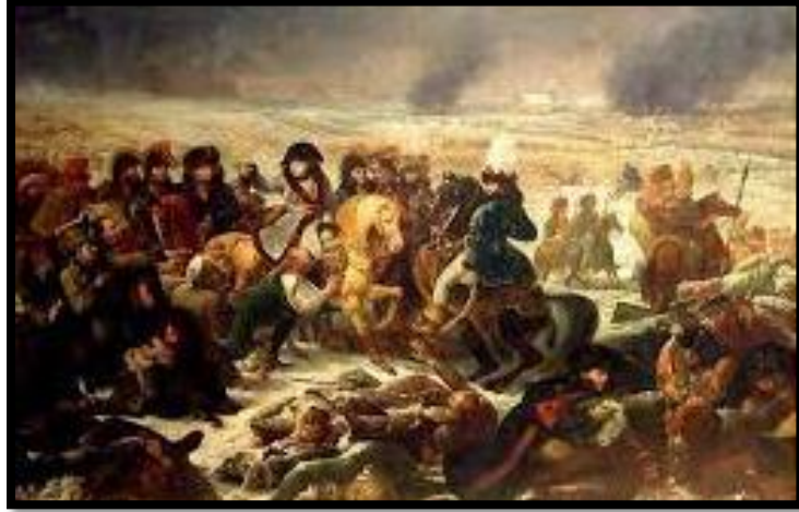
شكل 3: نابليون فى ساحة المعركة - جون أنطوان جروس-زيت على قماش - 521*784 - متحف اللوفر-1808 (1)

ويتضح مما سبق ان دائما ما كانت البيئة والمجتمع ذات دور اساسى فى الهام الفنانين والمفكرين فى اعمالهم الفنية التى تصطبغ بصبغة الحياة التى يعيش فيها والاحداث التى مرت عليه او على مجتمعه وشعبه.