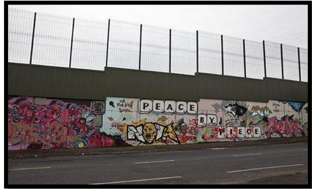
شكل 20: جرافيتي على الجدار العازل ببلفاست في أيرلندا (3)