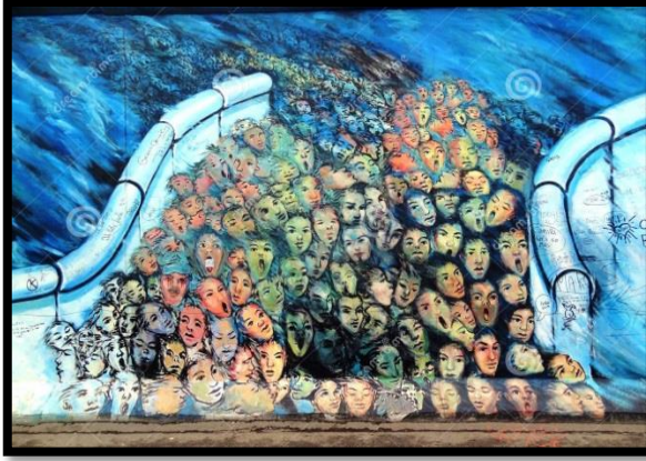
شكل 16: لوحة للشعب الألماني وهو يقف خلف الجدار (2)