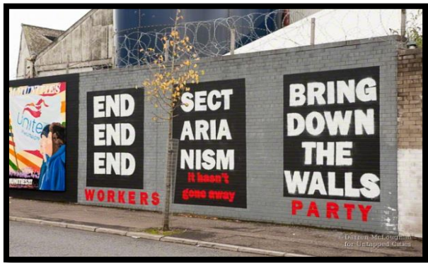
شكل 19: جرافيتي على الجدار العازل ببلفاست في أيرلندا (2)