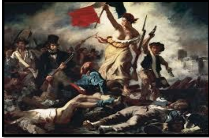
شكل 2: الحرية تقود الشعوب - ديلاكروا - زيت على قماش - 260*325سم - متحف اللوفر - باريس - 1830 (1)

ترك الفنان الفرنسي أوجين ديلاكروا Eugène Delacroix أثر يلهب حماس كل من رآه (شكل 2)، حيث تتضمن تلك اللوحة العديد من المضامين الفكرية لمواجهة العنف حيث جسد فرنسا على شكل امرأة تحمل العلم الفرنسي وتتقدم الخطى غير عابئة بأشلاء الذين يقفون في طريقها في جو كله تكسير للقيود، ان الصورة ما زالت باقية في متحف اللوفر بباريس رمزاً لتلك الحقبة من حياة الشعب الفرنسي حين ثار على الطغاه في سبيل حريته، وتعتبر هذه اللوحة أعظم عمل فني في المذهب الرومنسي الحديث في ذلك الوقت ، فلقد صور ديلاكروا بقوة الاقناع بالواقع ، وعبر عن احتدام الصراع ومرارة الضياع، والاحتفال بانتصار الانتفاضة الثورية الشعبية والمعالجة اللونية والظلية في اللوحة تقوم على اساس العلاقات المتناقضة مع الشدة المتزايدة للون.