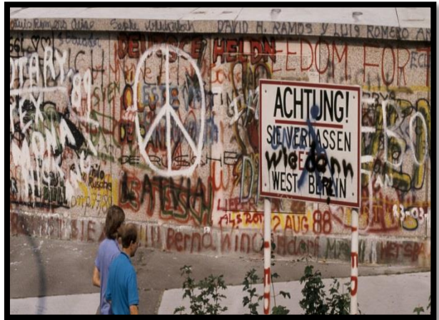
شكل 13: حائط برلين، 1989م (3)