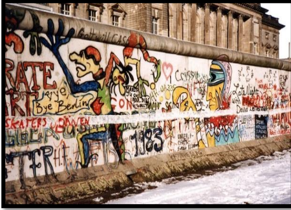
شكل 12: حائط برلين، شرق برلين، 1987م (2)