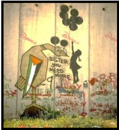
شكل 7: الجدار الفاصل بالضفة الغربية (3)