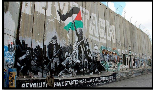
شكل 4: جرافيتي للإنتفاضة الفلسطينية على الجدار الفاصل بالضفة الغربية ومحاكاة للوحة الحرية تقود الشعوب (2)