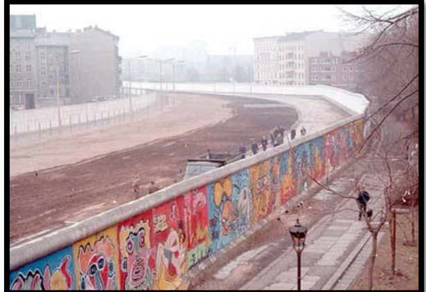
شكل 11: صورة لحائط برلين، برلين كريوزبرغ، 1986. (1)