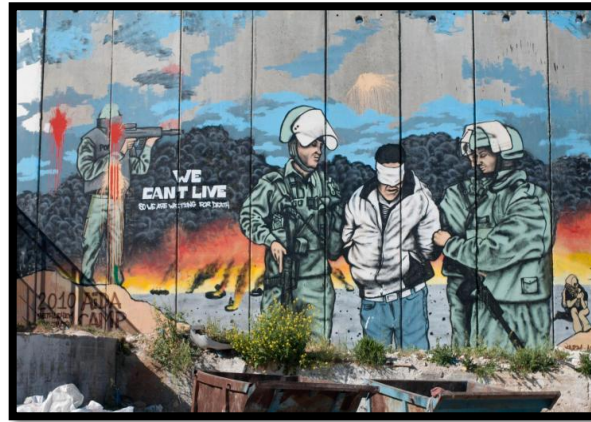
شكل 6: الجدار الفاصل بالضفة الغربية (4)