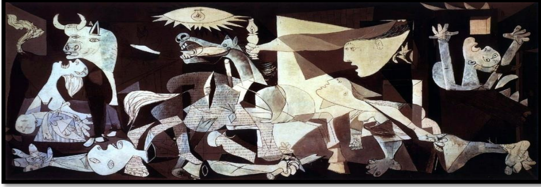
شكل 1 : الجورنيكا (Guernica) ،بابلو بيكاسو، زيت على توال، 350.5سم*782.3سم، 1937، محفوظة في the collection of Museo Reina Sofia, Madrid, Spain. (1)

وقد كان الغرض الأساسي من هذا القصف هو اختبار الآثار التدميرية الناتجة عن نوع جديد من القنابل الحارقة شديدة الانفجار على السكان المدنيين، كما بدأ بيكاسو العمل على الفور بأنفعال شديد مع الحدث ، فرسم في أول مايو (إسكتشاً) تخطيطياً أولاً يحتوى على الملامح الرئيسية للوحة النهائية ، إلا أنه كان مجرد خطوط غامضة غير واضحة المعالم ، وقد استمر ذلك شهراً كاملاً من العمل المضنى منذ بداية الرسم الأولى وحتى اكتمال اللوحة.