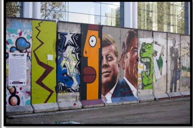
شكل 15 : جزء من الجدار أمام فندق "مين ستريت ستيشن " في لاس فيغاس (1)