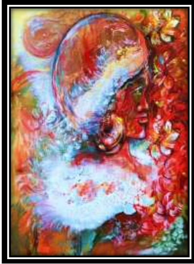
شكل (٢٦) التجربة الأولى لتفعيل التخيل في الترخيم (٦)