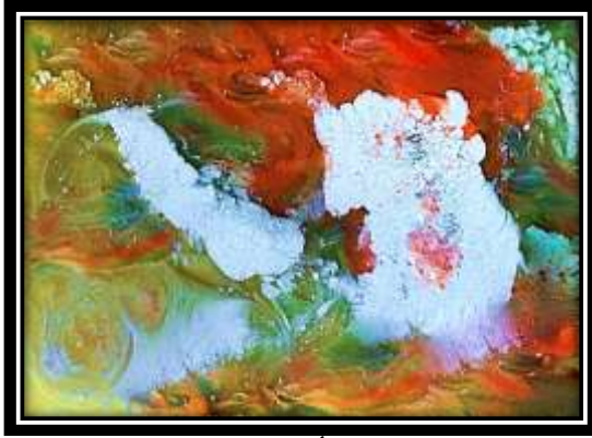
٦- اللوحة الأصلية (الترخيم اللوني)