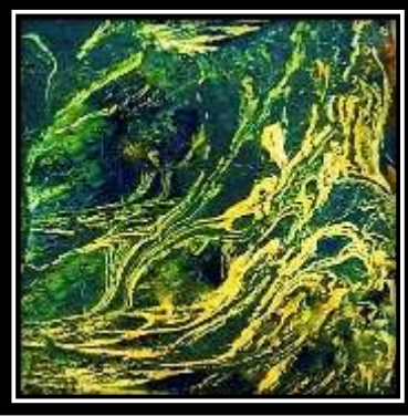
(شكل ٢) الخامات المستخدمة في الترخيم: ألوان زيت