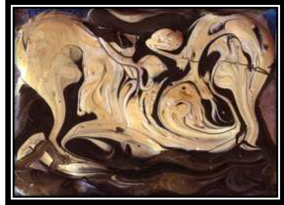
(شكل ١٢) الخامات المستخدمة في الترخيم: ألوان بلاستيك