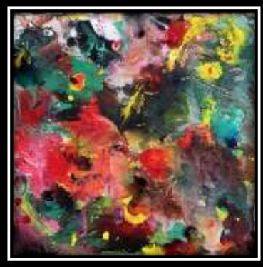
(شكل ٥) الخامات المستخدمة في الترخيم: ألوان بلاستيك