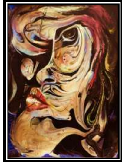
شكل (٢٥) التجربة الثانية لتفعيل التخيل في الترخيم (٥)

(تفعيل التخيل في أعمال من الترخيم اللوني) من أعمال الطلاب أبعاد العمل: (٣٠سم × ٤٠سم)