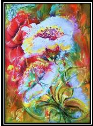
شكل (٢٧) التجربة الثانية لتفعيل التخيل في الترخيم (٦)