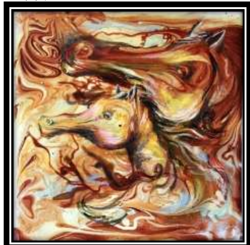
شكل (١٧) التجربة الثانية لتفعيل التخيل في الترخيم (١)

(تفعيل التخيل في أعمال من الترخيم اللوني) من أعمال الطلاب أبعاد العمل: (٢٥سم × ٢٥سم)