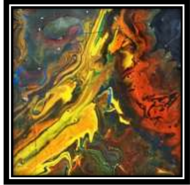
(شكل ١) الخامات المستخدمة في الترخيم: ألوان لاكية