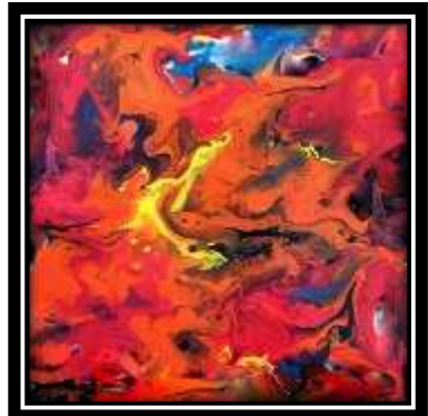
(شكل ٧) الخامات المستخدمة في الترخيم: ألوان بلاستيك

(ترخيم لوني) من أعمال الطلاب أبعاد الأعمال: (٢٥ سم × ٢٥ سم)