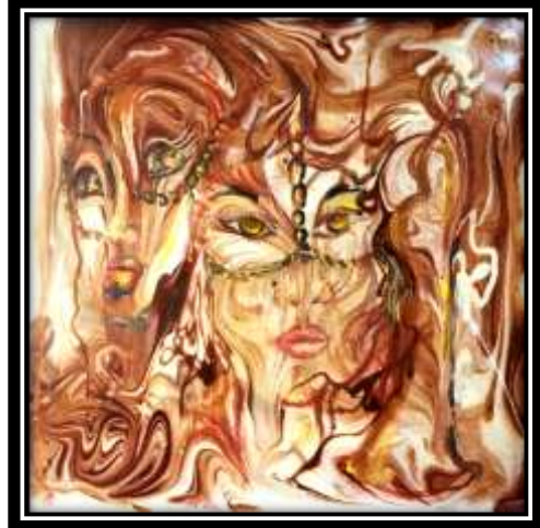
شكل (١٦) التجربة الأولى لتفعيل التخيل في الترخيم (١)