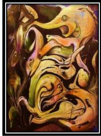
شكل (٢٤) التجربة الأولى لتفعيل التخيل في الترخيم (٥)