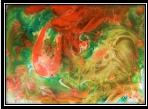
(شكل ١٣) الخامات المستخدمة في الترخيم: راتنج بوليستر، ألوان زيت