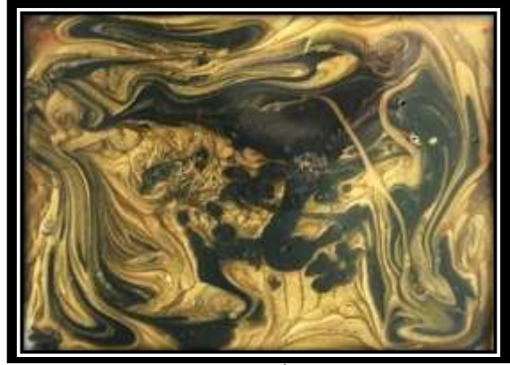
٣- اللوحة الأصلية (الترخيم اللوني)