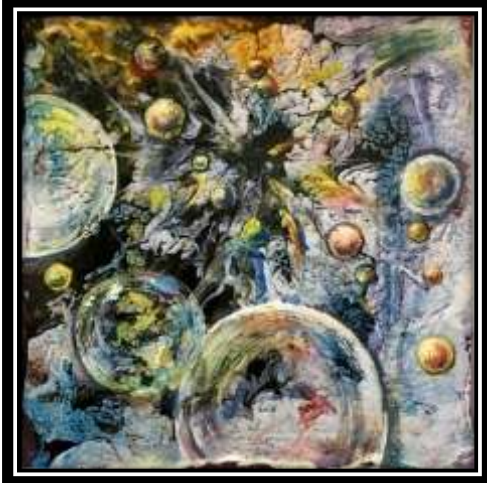
شكل (١٨) التجربة الأولى لتفعيل التخيل في الترخيم (٢)