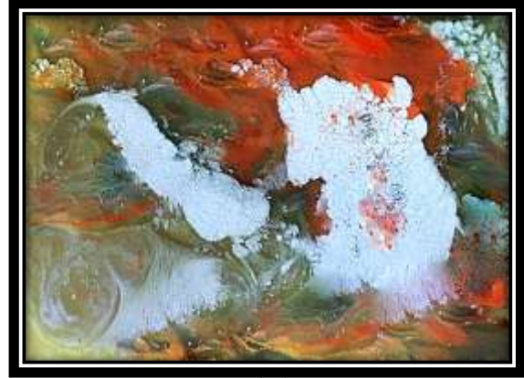
(شكل ١٠) الخامات المستخدمة في الترخيم: ألوان لاكية، أكاسيد معدنية، وورنيش شفاف