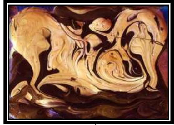
٥- اللوحة الأصلية (الترخيم اللوني)