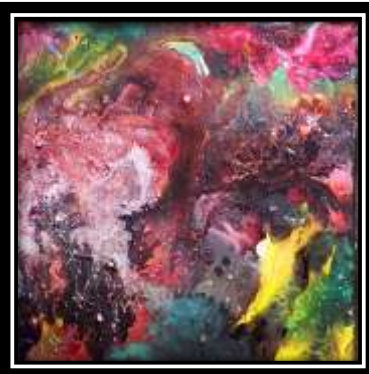
(شكل ٨) الخامات المستخدمة في الترخيم: ألوان جواش