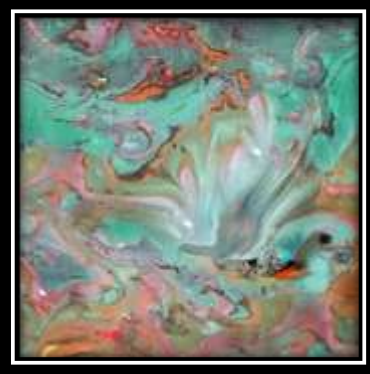
(شكل ٦) الخامات المستخدمة في الترخيم: ألوان جواش