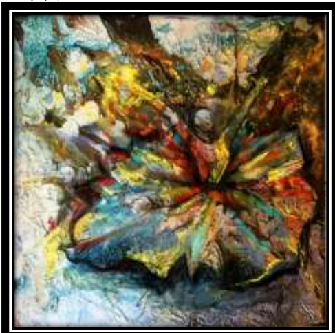
شكل (١٩) التجربة الثانية لتفعيل التخيل في الترخيم (٢)