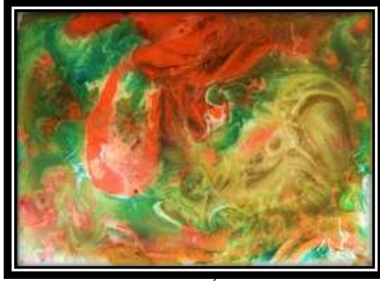
٧- اللوحة الأصلية (الترخيم اللوني)