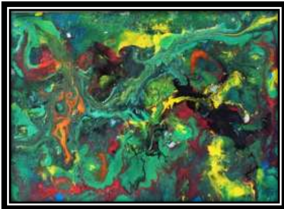
(شكل ١٥) الخامات المستخدمة في الترخيم: ألوان زيت