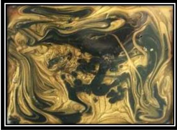
(شكل ١١) الخامات المستخدمة في الترخيم: لاكية وورنيش وأكاسيد معدنية.