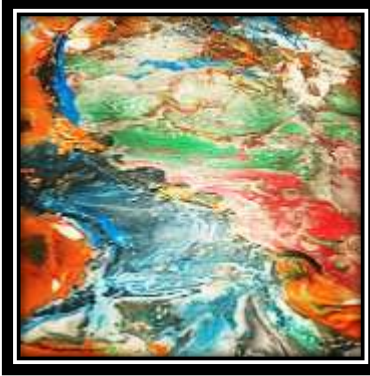
(شكل ٣) الخامات المستخدمة في الترخيم: ألوان لاكية، وأكاسيد معدنية