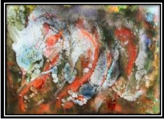
٤- اللوحة الأصلية (الترخيم اللوني)