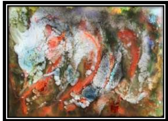
(شكل ١٤) الخامات المستخدمة في الترخيم: راتنج بوليستر، الوان جواش