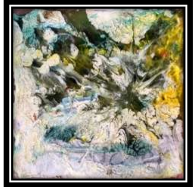
(شكل ٤) الخامات المستخدمة في الترخيم: بوليستر، أكسيد زنك