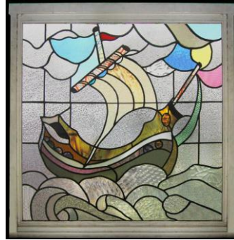
شكل ( ٣ ) الرسم على الزجاج في لمشغولات الفنية الحديثة ( ٢٠١٤ )