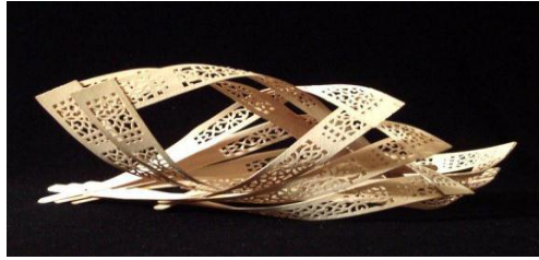
شكل ( ٤ ) مشغوله فنية حديثة باستخدام الاخشاب (نخيلة، ٢٠١٤):