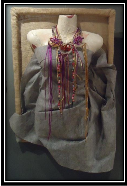
المشغولة (١٦) دلالية مكملة لزينة الصدر

بحيث تغطي المشغولة جميع منطقة الصدر وتتدلى حتى منطقة الخصر ، وساهم ذلك في إظهار الحركة والتنوع في المشغولة ، كما أضافت الباحثة شريطين من الأحجار الزاهية على جانبي المشغولة ، لتندلي بجوار الشرائط الملونة ، وتكسر الرتابة التي ظهرت من خلال تدلي الأشرطة الملونة ، وقد اختارت الباحثة وضع الأشرطة الذهبية في نصف المشغولة الأيمن ، وتم ترديد اللون في القطعة البلاستيكية في يسار المشغولة ، أيضا تم ترديد اللون البنفسجي في أجزاء المشغولة المختلفة من خلال وضعه في الجزء الأيسر للمشغولة ، والتبديل بين الأشرطة الذهبية والبنفسجية في المنتصف ، وقد إختارت الباحثة اللون الرمادي لعرض القطعة المكملة للزينة عليه ، كونه من الألوان المحايدة التي من شأنها أن تظهر الألوان الزاهية للمشغولة.