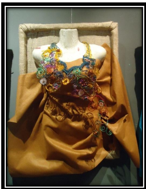
المشغولة رقم (٧) دلالية مكملة لزيينة الصدر

الأساليب التقنية : التشكيل بالأسلاك وشرائط البلاستيك ، الكروشيه مع السلك النحاس ، الإضافة ، النسيج ، التخريم.