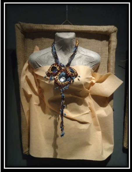
المشغولة رقم (٢) دلالية مكملة لزيينة الصدر