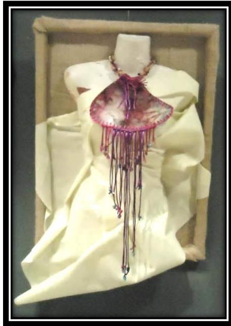
المشغولة (١٨) دلالية مكملة لزينة الصدر

أبعاد المشغولة : ٥٥سم طول × ٢٥سم أكبر عرض للمشغولة مثبتة على لوحة بمقاس ٧٠×٥٠سم ، مكونة من ثلاث مستويات ، خلفية العمل من الخيش مثبت عليها نصف علوي لمانيكان مجسم ، تم تغطيته بقماش جوخ صناعي وذلك تمهيدا لعرض القطعة المكملة للزينة عليه . الخامات : قطعة بلاستيكية مستهلكة ، طلاء أظافر ، خرز بلاستيكي ، شرائط ساتان مبرومة .