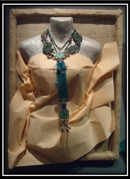
المشغولة (١٢) دلالية مكمل لزيينة الصدر

مجموعة لوحات الكترونية متنوعة الأحجام ، وتأخذ الوحدة الرئيسية فالمشغولة شكل المستطيل ، وتتنوع باقي الوحدات بين الأشكال المربعة والثمانية، أيضا استخدمت الباحثة أحجام متنوعة من الخرز البلاستيكي فضي اللون ليطماشى مع اللون الفضي الموجود على اللوحات الالكترونية ، وبذلك تحقق التردد في المشغولة ، كما تم استخدام مجموعة من الأحجار ذات اللون الأخضر القاتم