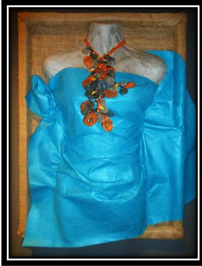
المشغولة (١) دلالية مكملة لزينة الصدر

أبعاد المشغولة : ٣٠سم طول × ١٠سم أقصى عرض للمشغولة مثبتة على لوحة بمقاس ٧٠×٥٠سم ، مكونة من ثلاث مستويات ، خلفية العمل من الخيش مثبت عليها نصف علوي لمانيكان مجسم ، تم تغطيته بقماش جوخ صناعي وذلك تمهيدا لعرض القطعة المكملة للزينة عليه. الخامات : أسلاك معدنية ، بولي استر ، خرز زجاجي ، احجار.