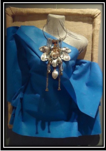
المشغولة (١٤) دلالية مكملة لزينة الصدر

، والسلاسل المعدنية كخامات مكملة للمشغولة الفنية ، تتخذ المشغولة شكل المثلث قاعدته في الجزء العلوي ورأسه في الجزء السفلي ، مما أضفى نوعاً من الرشاقة على المشغولة الفنية ، وتعتمد الأساليب التقنية بصورة أساسية على التجميع والتطعيم باستخدام القطع الكريستالية التي تم توزيعها على جانبي المشغولة ، وقد تم الإعتماد على اللون الفضي كلون أساسي و كان لاستخدام السلك النحاس الأحمر دوراً هاماً في إبراز التنوع اللوني في المشغولة ، وقد اختارت الباحثة اللون الفيروزي لعرض المشغولة كونه من الدرجات اللونية المتناسقة مع اللون الفضي مما كان له أثر كبير في التأكيد على القيم الجمالية في المشغولة الفنية المكملة للزينة.