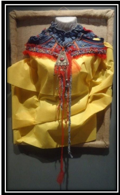
المشغولة (١٧) دلالية مكملة لزينة الصدر

بحيث تغطي المشغولة جميع منطقة الصدر وتتدلى حتى منطقة الخصر ، وساهم ذلك في إظهار الحركة والتنوع في المشغولة ، كما أضافت الباحثة شريطين من الأحجار الزاهية على جانبي المشغولة ، لتندلي بجوار الشرائط الملونة ، وتكسر الرتابة التي ظهرت من خلال تدلي الأشرطة الملونة ، وقد اختارت الباحثة وضع الأشرطة الذهبية في نصف المشغولة الأيمن ، وتم ترديد اللون في القطعة البلاستيكية في يسار المشغولة ، أيضا تم ترديد اللون البنفسجي في أجزاء المشغولة المختلفة من خلال وضعه في الجزء الأيسر للمشغولة ، والتبديل بين الأشرطة الذهبية والبنفسجية في المنتصف ، وقد إختارت الباحثة اللون الرمادي لعرض القطعة المكملة للزينة عليه ، كونه من الألوان المحايدة التي من شأنها أن تظهر الألوان الزاهية للمشغولة.