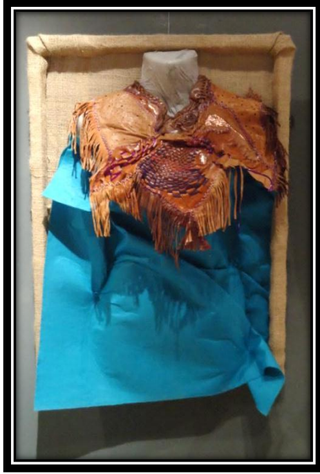
المشغولة ( ١٩ ) دلالية مكملة لزينة الصدر

القيم الجمالية والفنية للمشغولة: تغطي المشغولة الأكتاف والمنطقة العليا من الصدر بشكل كامل ، بحيث تشبه الحرملة المعروفة في الفن المصري القديم، وتعتمد على مجموعة من قطع الجلد الطبيعي المستهلكة ، والمعاد استخدامها ، وتم تطبيق مجموعة من الأساليب التقنية المتنوعة الخاصة بخامة الجلد الطبيعي ، مثل التشريط لإنتاج الشراشيب في أسفل المشغولة ، والنسج باستخدام التشريط المتدرج في السماكة والشرائط الجلدية من درجات اللون البنفسجي ، كما تم التطريز بالخياوط القطنية بذات اللون مما ساهم في التأكيد على الوحدة والترابط في المشغولة الفنية، وقد اختارت الباحثة اللون الفيروزي ليتم عرض المشغولة عليه للتأكيد على القيم اللونية فيها .