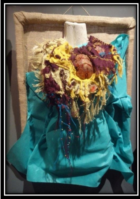
المشغولة رقم (٤) حرملة مكملة لزينة الصدر

أبعاد المشغولة : ٥٠ سم طول × ٤٠ سم أكبر عرض للمشغولة مثبتة على لوحة بمقاس ٧٠×٥٠سم ، مكونة من ثلاث مستويات ، خلفية العمل من الخيش مثبت عليها نصف علوي لمانيكان مجسم ، تم تغطيته بقماش جوخ صناعي وذلك تمهيدا لعرض القطعة المكملة للزينة عليه . الخامات : قطع بولي استر ، خيش ملون ، خيوط كوتونبرليه ، قماش تل ، خرز خشبي ، سلك نحاس احمر.