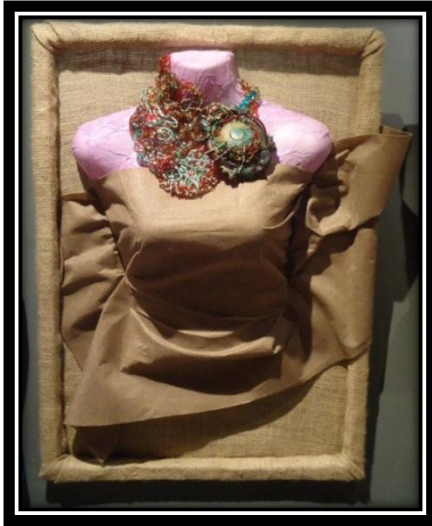
المشغولة (١٥) دلالية مكملة لزينة الرقبة

القيم الجمالية والفنية للمشغولة : تعد هذه المشغولة من