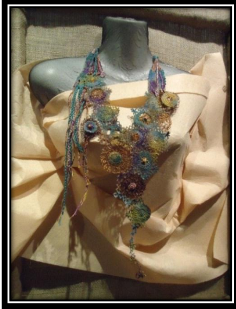
المشغولة (٨) دلالية مكملة لزينة الصدر