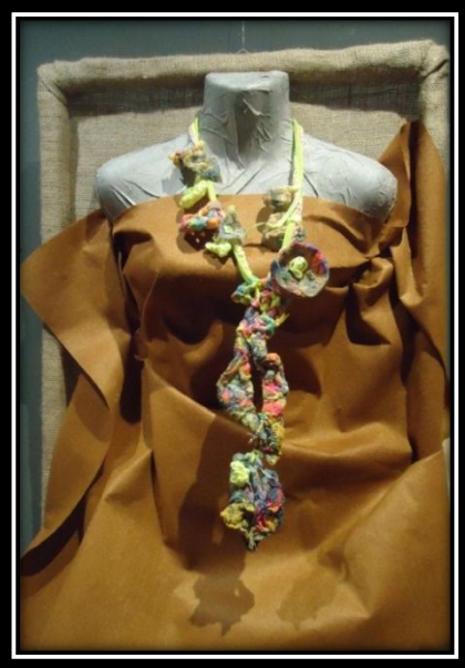
المشغولة (٩) دلالية مكملة لزينة الصدر

أبعاد المشغولة : ٤٥سم طول × ٢٠سم أكبر عرض للمشغولة مثبتة على لوحة بمقاس ٧٠×٥٠سم ، مكونة من ثلاث مستويات ، خلفية العمل من الخيش مثبت عليها نصف علوي لمانيكان مجسم ، تم تغطيته بقماش جوخ صناعي وذلك تمهيدا لعرض القطعة المكمل للزينة عليه .