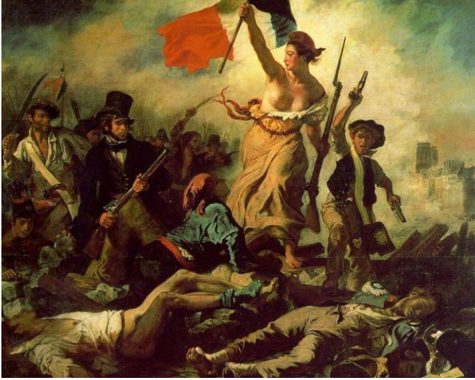
شكل رقم (3)