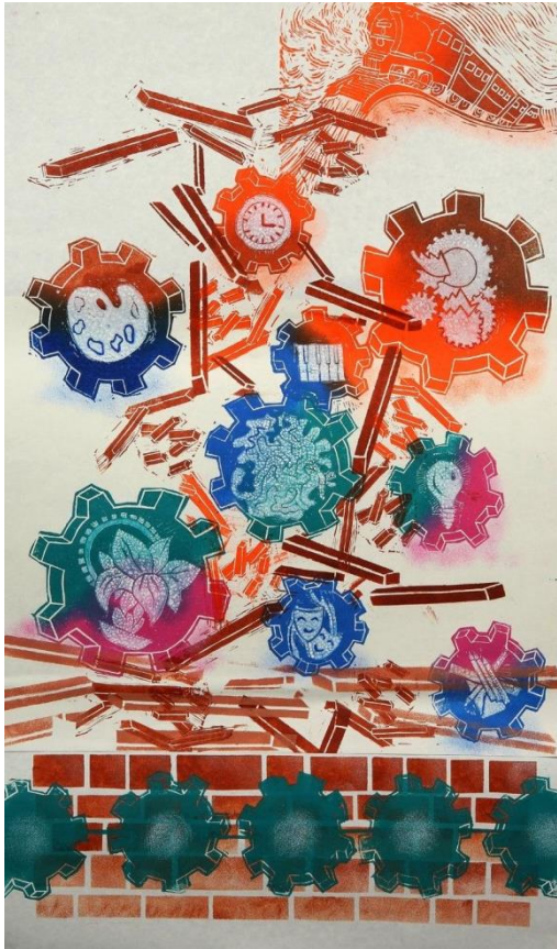
شكل رقم (12)

مفهوم التطوير هو التحويل من طور الي طور. و تعني كلمة تطوير تحول من طوره: أي التغيير التدريجي الذي يحدث في بنية الكائنات الحية و سلوكها. و يطلق أيضاً على التغيير التدريجي الذي يحدث في تركيب المجتمع أو العلاقات أو النظم أو القيم السائدة فيه. وهو مصطلح "تحسين" وصولاً الي تحقيق الأهداف المرجوة بصورة أكثر كفاءة.