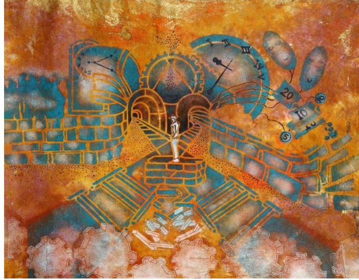
شكل رقم (13)

ترتبط الحياة بثلاث مجموعات من القيم التي تتجلى فيها المعاني: قيم ابداعية، قيم خبرية، قيم اتجاهية. معني الاولي ما يعطيه للعالم في صور ابداعيات، الثانية ما يأخذه من العالم في صورة خبرات، الثالثة الموقف الذي يتخذه في محنته في حالة ما إذا كان يجب عليه أن يواجه قدرًا لا يمكن تغييره، ولهذا ما ينتجه المجتمع من قيم، خبرات، صور واضحة للحياة الاجتماعية.. ماهيه إلا ظواهر اجتماعية تكتسب معانيها في مسار التفاعل بين الفرد و الآخرين. فمعنى الحياة مرتبط بمعرفة الظروف التي تشكل مكوناتها وهي : وظيفية، اجتماعية، جنسية و أن الجنس البشري يعتمد علي هذه المكونات، و إن الحياة يكون لها معني عندما نساهم مساهمة ايجابية في حياة الآخرين، حيث أن التعاون هو الحماية الحقيقية ضد احتمال حدوث أي أُنانية. و أن الافراد يتواصلون مع البيئة المحيطة بهم من خلال حواسهم.. يؤثرون و يتأثرون من خلالها و تساعدهم علي تطوير أدائهم. وهذا التطوير يؤدي الي خبرات و معارف و علاقة تفاعل ينتج عنها معنى الحياة.