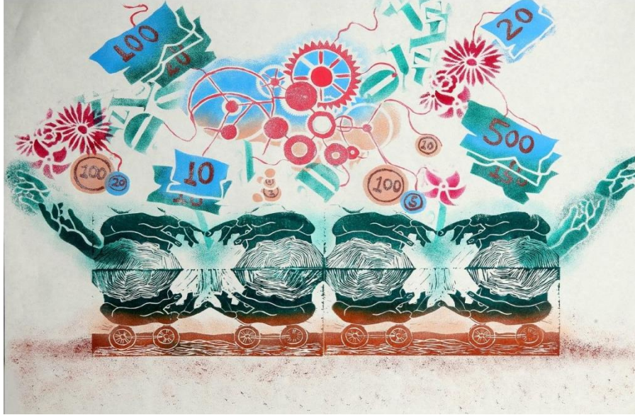
شكل رقم (11)

يتجلى معنى المساهمة في المشاركة، العطاء، اللغة، مد يد التعاون، العلم، الاتصال المادي، و المشاعر و الحب اللذان يؤديان الي طاقة متجددة في جوانب الحياة المتعددة. فالحب شكل من أشكال الطاقة الروحية، التي يمكن أن تتحول الي طاقة حركية دافعة.. ترتبط أيضاً بالأفعال .. و تنتج في نفس الوقت الطاقة الحركية أثناء تحركها و يستخدم لإنتاج طاقة إشعاعية تضئ الطريق. كما يخترن الزنبرك المضغوط الطاقة و حب العلم يمثل في المتعة في البحث و الاكتشاف و تقديم نتائجه في خدمة المجتمع و الوطن. أنها المضامين تترجم مفهوم المساهمة عند الفرد في المجتمع.