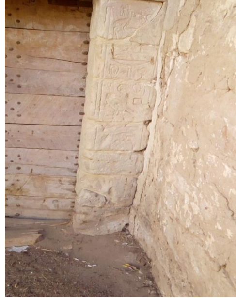
لوحة (1) النقوش الهيروغليفية على مدخل بعض المنازل