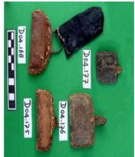
لوحة (19) بعض الاحجية