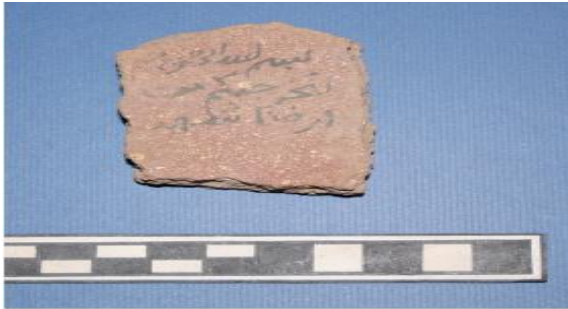
لوحة (4) وستراكا بكتابات عربية