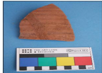
لوحة (5) الاوستراكا القبطية