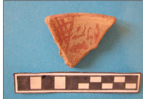
لوحة (3) قطعة من الفخار عليها نقوش حمراء