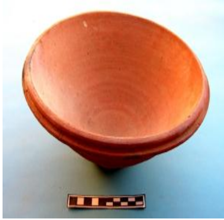
لوحة (16) سلطانية فخارية