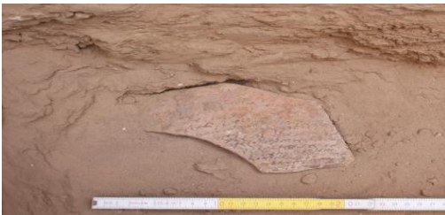
لوحة (6) الاوستراكا الرومانية