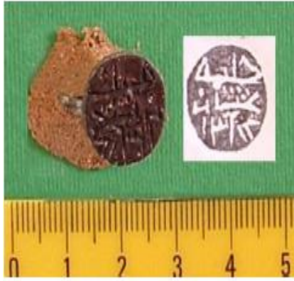
لوحة (18) ختم للسيدة حليلة عثمان