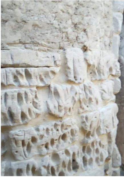
لوحة (2) ازالة النقوش الهيروغليفية من الجدران