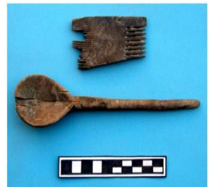
لوحة (13) شنطة الخضار