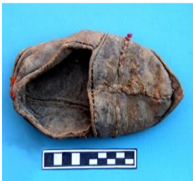
لوحة (14) وعاء الطبخ