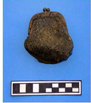
لوحة (15) محفظة نقود جلد