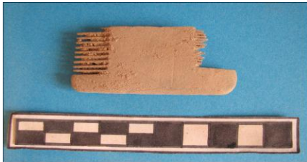
لوحة (10) قطعة زينة م