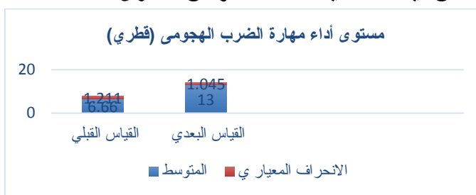
شكل ( 3 )

يتضح من جدول (٧) وجود فروق ذات دلالة إحصائية بين القياسين القبلى والبعدي لعينة البحث فى مستوى أداء مهارة الضرب الهجومي وفى اتجاه القياس البعدي حيث أن قيمة احتمالية الخطأ أصغر من مستوى الدلالة ٠,٠٥.